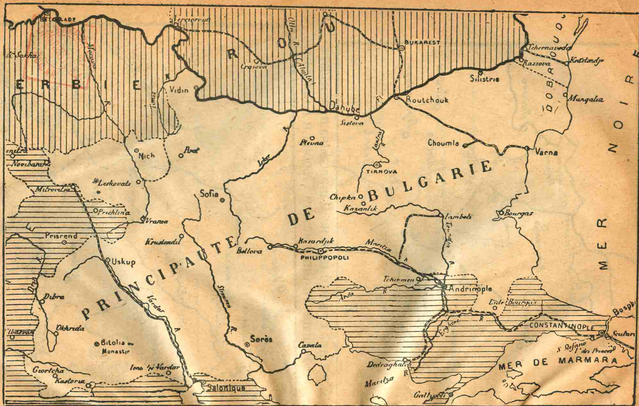
Карта приложена при Сант-Стефанския договоръ, 1878 г.

1878 ГОД. ВСЯКИКЪ ВЕЛИКИЪ СИЛИ. ТОВА ПРИЗНАХА ТЪРЖЕСТВЕНО ЗА БЪЛГАРСКО ВЪ