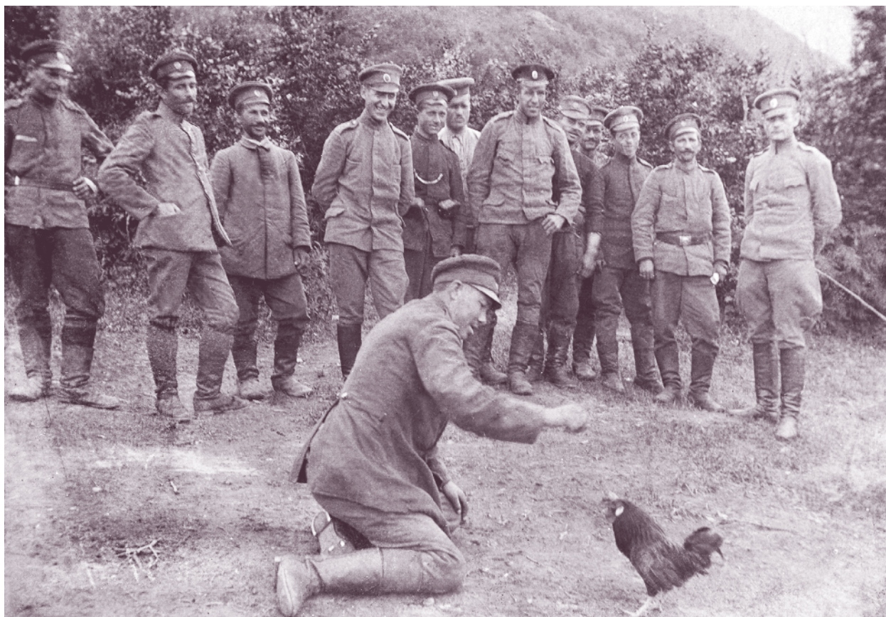
Войник от 62-ри пехотен полк забавлява другарите си на фронта през Първата световна война

За участие в Първата световна война (1915–1918) на 22 август 1915 г. в Стара Загора е формиран 4-ти пехотен кадрови полк, наречен впоследствие 4-ти пехотен Македонски, който е включен в състава на Македонската дивизия. Негов командир е полковник Георги Генчев. Води бойни действия в състава на 2-ра бригада на дивизията, която от 18 септември е изведена от състава на Македонската дивизия и настъпва на отделно направление към Куманово. След провала на съглашенското настъпление на север бригадата е върната в състава на 11-а пехотна Македонска дивизия и заема участък за отбрана на гръцката граница.