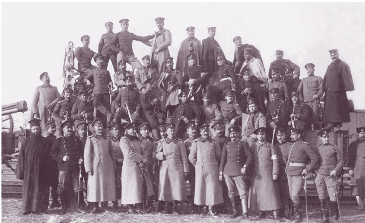
Офицери от 49-и пехотен полк в гр. Драма, на път за Източна Тракия, 1912 г.

Полкът взема участие в Балканската война (1912–1913) . На 5 октомври 1912 г. в 7:30 ч. 3-та Рилска бригада преминава българо-турската граница и настъпва с бой към Баракovo и Горна Джумая. До вечерта те са освободени, а полковете достигат линията Грамада – Велмзино. В боевете за освобождаване на Горна Джумая са пленени 140 души и са взети 3 турски оръдия, но полкът дава и първите си жертви. На 6 октомври 49-и пехотен полк освобождава Железница, а на следващия ден достига линията Ораново – Симитли. На 8 октомври той освобождава Симитли и Ораново.