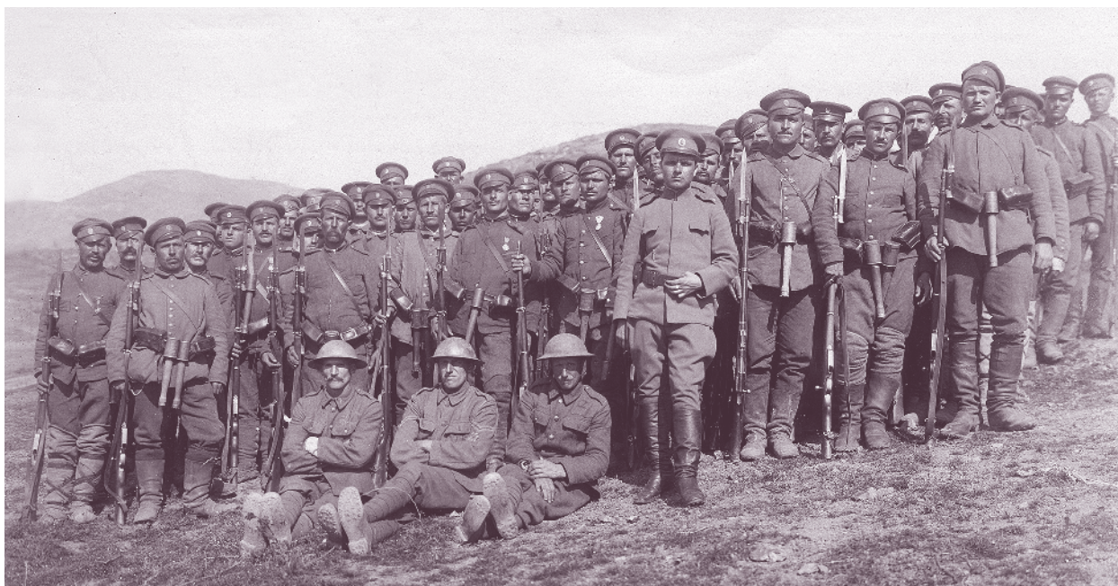
Команда от 57-и пехотен полк, заловила трима англичани на Високата змийска висота, Дойранска позиция, 1 април 1917 г.

с. Чидимлий. С минимални загуби е уточнено, че срещу полка са вече английски войски, сменили френските през втората половина на август. В хода на „малката война“ – до края на 1916 и през първите месеци на 1917 г., продължават дооборудването на позициите, патрулната дейност, безбройните артилерийски обстрели и кратките боеве, довели до значителни допълнителни жертви сред полка.