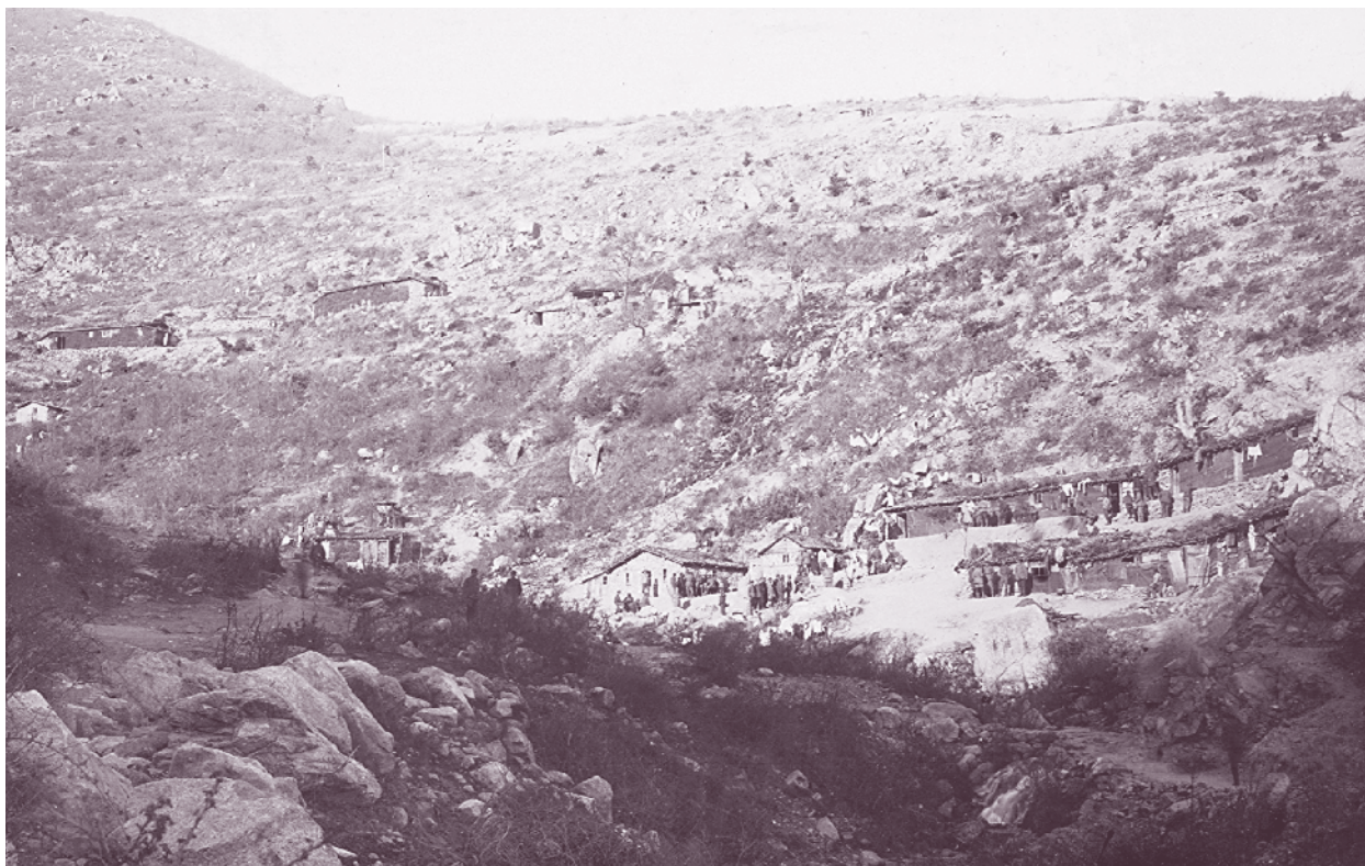
Бивакът на 60-и пехотен полк зад позицията Търлите през Първата световна война

Формиран е на 3 май 1913 г. след приключване на войната с Турция, въз основа на Заповед № 1 на командира на 1-ва пехотна резервна дивизия, в с. Бояна – от 1-ва, 16-а, 22-ра и 26-а сборна дружина и част от 53-ти пехотен полк. Участва във Втората балканска война (1913 г.) . Включен е в новосформираната 12-а пехотна дивизия, която действа в състава на Пета армия. Дивизията към 18 юни е съсредоточена в района на Кюстендил и Коньово и получава задача да настъпни и достигне линията Узем – вр. Китка – Сиври тепе. С една дружина до 19 юни 60-и пехотен полк успява да заеме западните склонове на върховете Амудия и Китка. Участва в настъплението на дивизията на 20 юни, води боеве със сръбските войски за овладяване на височини 1134 и 1120 около Киселица и в района на вр. Китка, където сърбите са изградили упорита отбрана. Впоследствие полкът в състава на дивизията е върнат на старата граница и участва в боевете за спиране на сръбското настъпление в направление към Кюстендил, проведено след провала на настъплението срещу частите на Четвърта армия на Калиманското плато. Понесли значителни загуби от упоритата отбрана на българите и смазващия им артилерийски огън, сърбите се отказват от настъплението. Полкът дочаква примирието на достигнатите позиции, след което е върнат в България и през август 1913 г. е разформиран в Хасково. Кадровият състав на полка е прехвърлен към 10-и и 30-и пехотен полк.