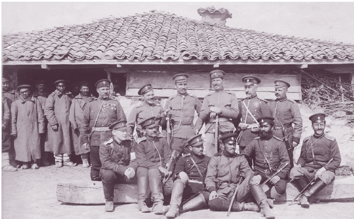
Офицери и войници от 42-ри пехотен полк, с. Мюселим, Източна Тракия, 14 март 1913 г.

В навечерието на Първата балканска война (1912–1913) 42-ри пехотен полк в състава на бригадата е дислоциран в с. Йос Беглъ (дн. Избеглиш). С обявяването на войната бригадата се изнася към границата и навлиза на турска територия, като 42-ри полк е в състава на главните сили. Първите ожесточени боеве пламват на 9 юни, когато авангардът на бригадата – 41-ви полк, посреща удара на 11-а низамска дивизия от настъпващия откъм Одрин турски подвижен корпус и чрез последователни боеве северно от Таушан – Коруджукьой, вис. Калето и с. Провадия успява да я спре. Турците хвърлят в боя и 10-а низамска дивизия, в отговор на което в подкрепа на усилията на добруджанци генерал Тепавичаров въвежда и 42-ри пехотен полк. Тежки са боевете на 10 октомври при Таушан – Коруджукьой, Мурачлъ, Кайпа и Чаргак баур. Те са ожесточени, загубите и на двете страни са големи. Една след друга са атаките на турските табори. Българите не отстъпват и отговарят с атаки „на нож“. Боевете продължават до 23 октомври, когато турците не издържат на дружната атака на 41-ви и 42-ри полк, подпомогнати от 16-и пехотен Ловчански полк, и отстъпват към Одрин. Пътят към Лозенград е открит за войските на Трета армия.