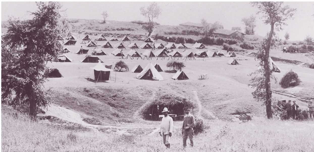
Лагерът на 69-и пехотен полк от Драмската бригада при с. Негован, Серско, 1913 г.

На 7 юли гръцките войски атакуват българската отбрана на десния бряг на реката и командирът на дивизията започва да прехвърля през моста Сали ага подкрепления от нейния ляв фланг. След пладне обаче противникът се насочва срещу позициите на малобройната Драмска бригада. Дружините от 69-и полк се сражават отчаяно, но след отгръпването на артилерията остават без подкрепа и се оттеглят на север по Кресненското дефиле, като водят бой с преследващите ги гръцки части. Полкът участва в окончателното спиране на противника на височините северно от Горна Джумая и в подкрепата на контраудара на българските войски срещу обградената в дефилето гръцка армия. Следва примирието през август 1913 г. и 69-и пехотен полк се завръща в Пазарджик, демобилизиран е и е разформиран.