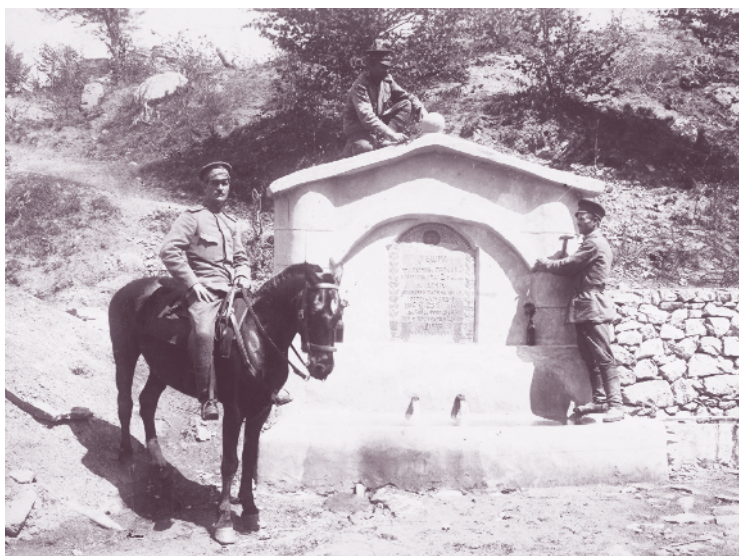
Чешмата „Поручик Петков“ край позицията на 60-и пехотен полк, вис. Чука, Беласица, 1917 г.

На 18 октомври 11-а пехотна Македонска дивизия завършва съсредоточаването си в района на Щип. Първата атака на Криволашката позиция е неуспешна. За втората атака в дивизията са формирани два бригадни участъка. В състава на бригадата 2-ри Македонски полк е в левия участък и настъпва през Серка планина, за да заема участъка от линията от с. Шехоба до с. Гарван. Но и втората атака на Криволашката позиция на 21 октомври е неуспешна. Така е и с проведената на 23 октомври трета атака. Претърпели