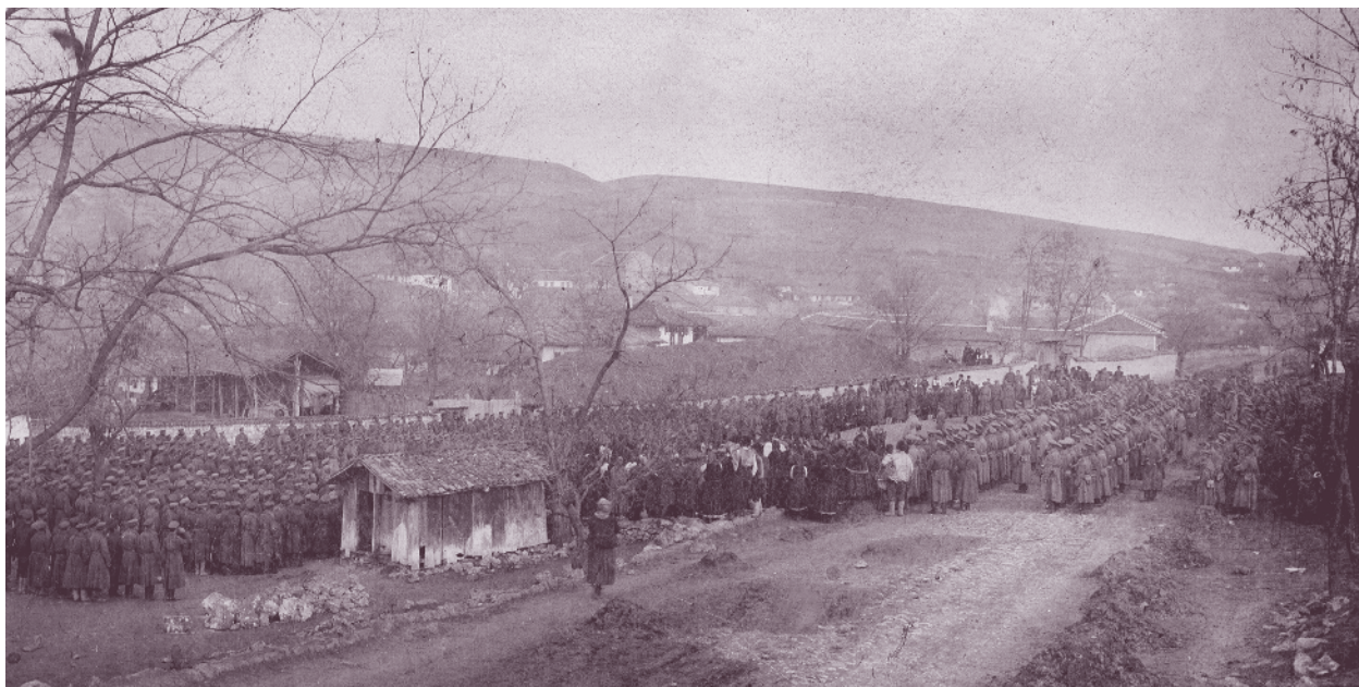
Парад на 48-и пехотен полк по случай рождения ден на престолонаследника княз Борис, село Гагаля, Русенско

участват в превземането на Тутраканската крепост. Особено силно се представят двете му дружини, които превземат фортове № 5 и № 6 на крепостта. Процентно те дават може би най-много жертви – 5 загинали и 14 ранени офицери, 146 убити, 624 ранени и 59 изчезнали войници.