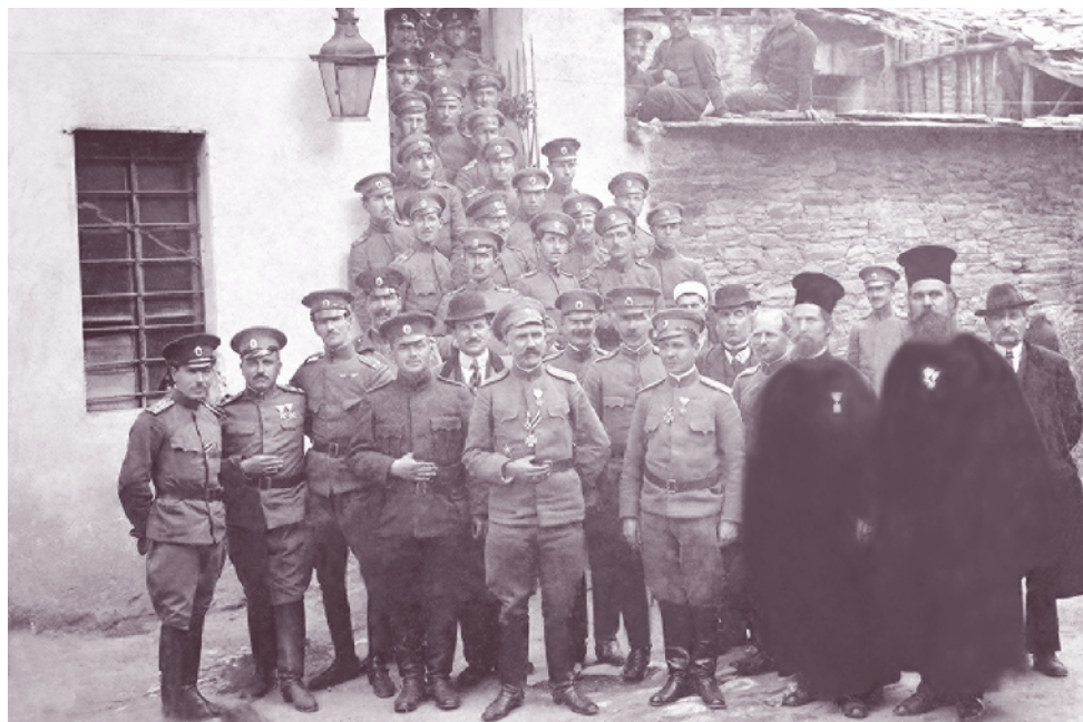
Полкови празник на 38-и пехотен полк, гр. Правище, 26 март 1918 г.

От 21 август 1916 г. до 20 декември 1917 г. 38-и пехотен Одрински полк заема позиции за отбрана на Беломорското крайбрежие в участъка Кара бунар – Сармусакли – Орфано – Кара баур. Стълкновенията с противника са редки, но има постоянен артилерийски обстрел, от който полкът търпи загуби. Единствено от 5 до 10 декември 1916 г. му се налага да води боеве при чифлика Тефик бей, Верусенли. До средата на 1918 г. отбранява позициите от р. Бродска до чифлика Вернар в Серско, воюва при Руски манастир, Правище, с. Локвица и Кара баур, а по-късно е отново на Орфанския залив. На 15 октомври 1918 г. след сключване на примирието 38-и пехотен полк се завръща в Кърджали, където е демобилизиран.