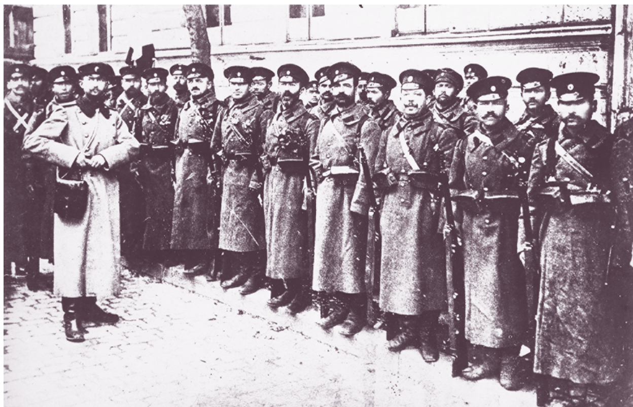
Четвърта рота от 37-и пехотен полк заминава за бойното поле, 23 септември 1912 г.

Полкът под командването на полковник Стефан Панайотов участва в Първата балканска война (1912–1913) в състава на 2-ра бригада на Софийската дивизия. Непосредствено преди войната 3-та пехотна бригада става 2-ра – поради изпращане на 2-ра пехотна бригада в състава на новосформираната 10-а пехотна Сборна дивизия, и софийци воюват в състав от две пехотни бригади.