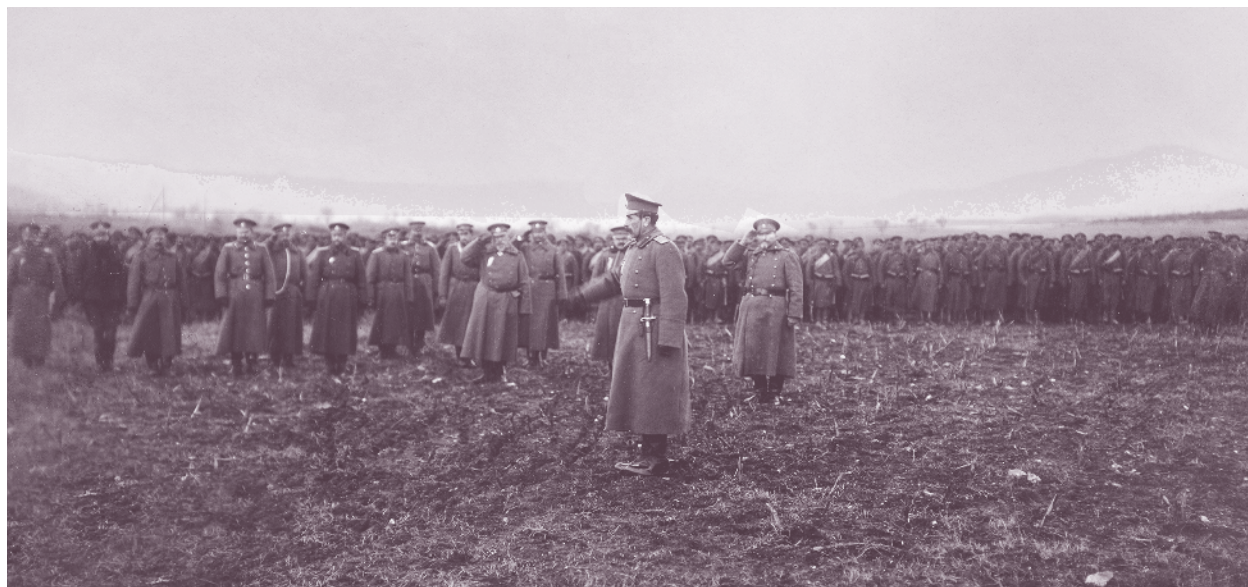
Войници от 43-ти пехотен полк слушат главнокомандващия генерал-майор Никола Жеков, 17 януари 1916 г.

ма укреплението Лисе и с. Старчища и взема изоставените от отстъпващите гръцки части оръдия и муниции. До вечерта бригадата достига манастира „Свети Димитър“ и височините на село Калапот. През следващите дни продължава безпрепятствено да настъпва на юг, заема с. Алистрат, прекосява Кушница планина и излиза на Орфанския залив. Така прекъсва изцяло комуникациите между 6-а и 7-а гръцка дивизия, дислоцирани около гр. Драма. Започналата офанзива на съглашенските войски принуждава армията да прекрати настъплението си и бригадата остава на достигнатите позиции.