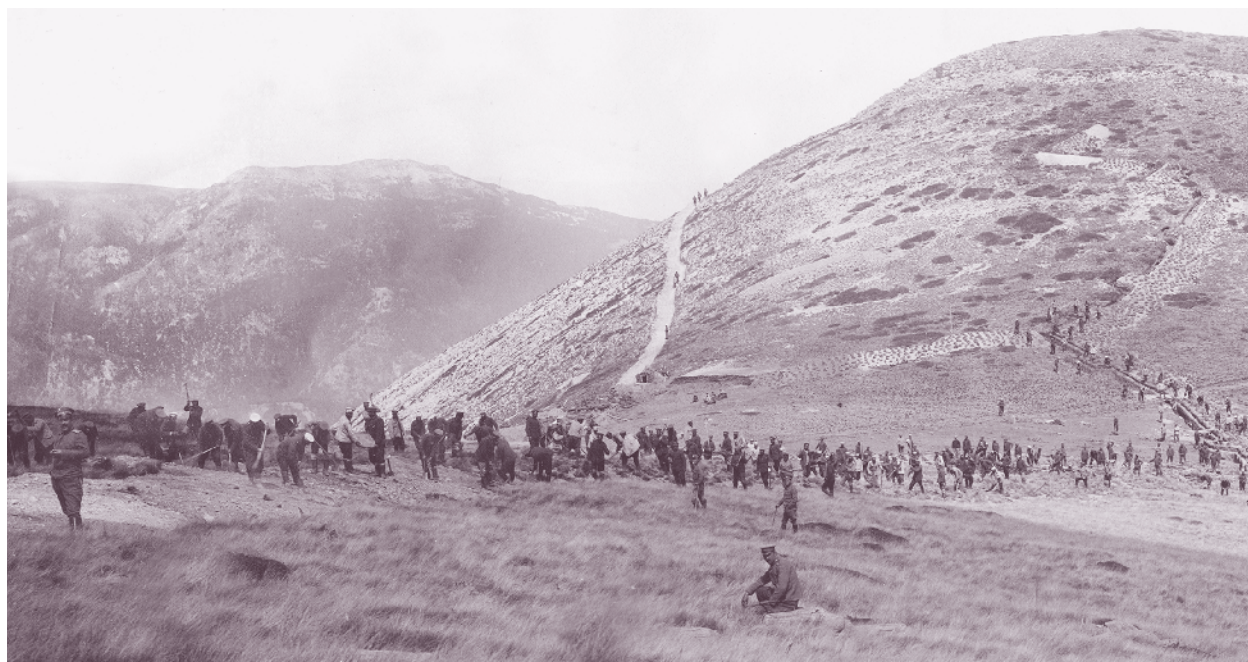
Работа по позицията – 12-а рота от 58-и пехотен полк

След разгрома на сръбската армия 58-и пехотен полк в състава на дивизията заема участък за отбрана на Дойранската позиция, където сменя германски части. Оборудват се позициите в очакване на съглашенско настъпление. Последователно се сменя на позиции с полкове от 2-ра Тракийска дивизия. През септември 1916 г. роты от полка са изпратени в подкрепа на 1-ва бригада от 3-та Балканска дивизия, водеща кръвопролитни боеве за удържане на вр. Каймак Чалан, заемащ важно място в българската отбрана. След падането му съглашенските войски се втурват в създалия се пробив на битолското направление. В края на 1916 г. 58-и пехотен полк е изпратен в района на Завоя на р. Черна, където нашите полкове търпят тежки загуби в хода на есенната офанзива на съглашенските войски.