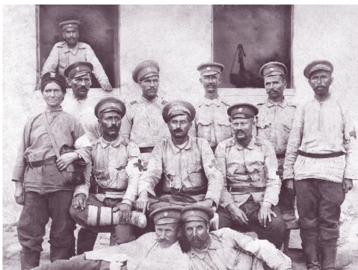
Част от героите от 55-и пехотен полк от боевете в Завоя на р. Черна (1916–1917)

участък и водейки откъслечни боеве с части на противника, опитващи се да провеждат разузнаване с бой.