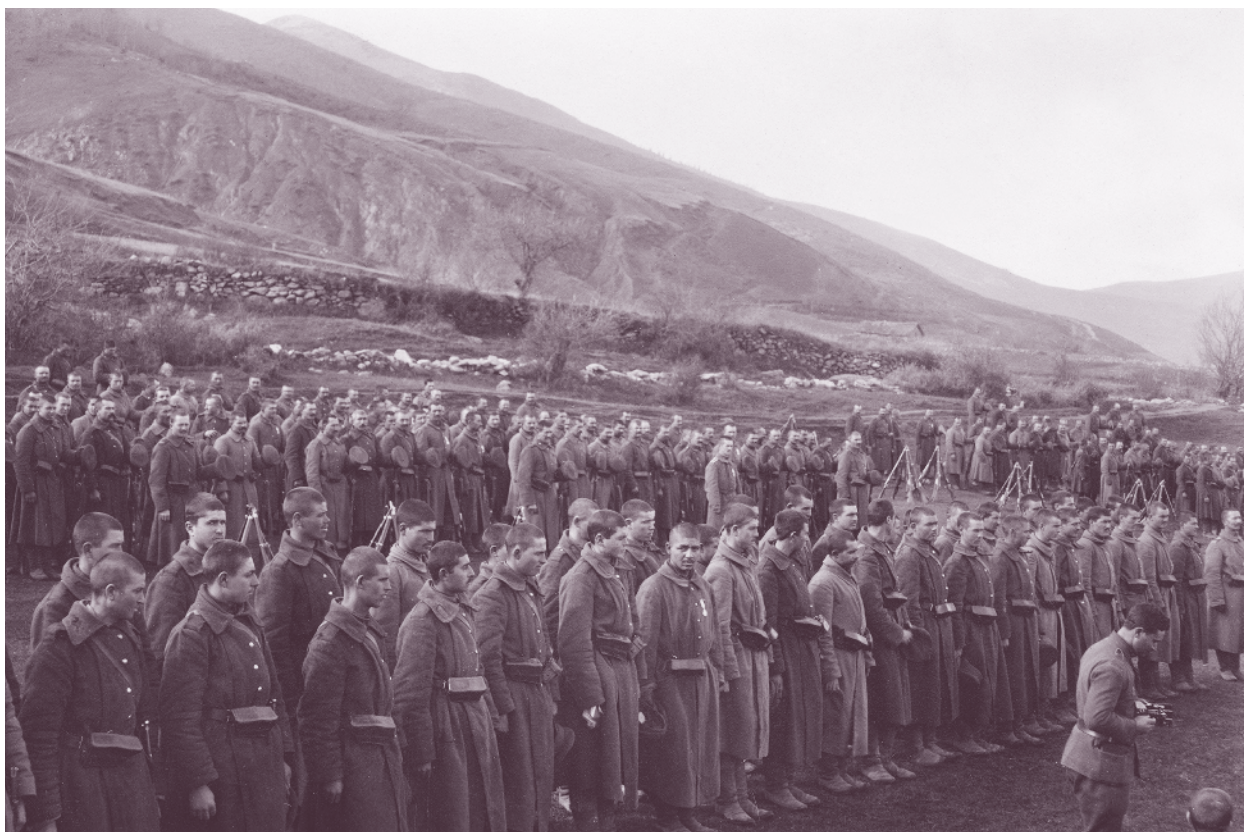
Клетва на войници от 51-ви пехотен полк през Първата световна война