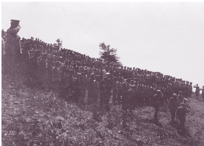
Командирът на 1-ва бригада от 3-та пехотна Балканска дивизия поздравява новосформирания 80-и пехотен полк, август 1917 г.