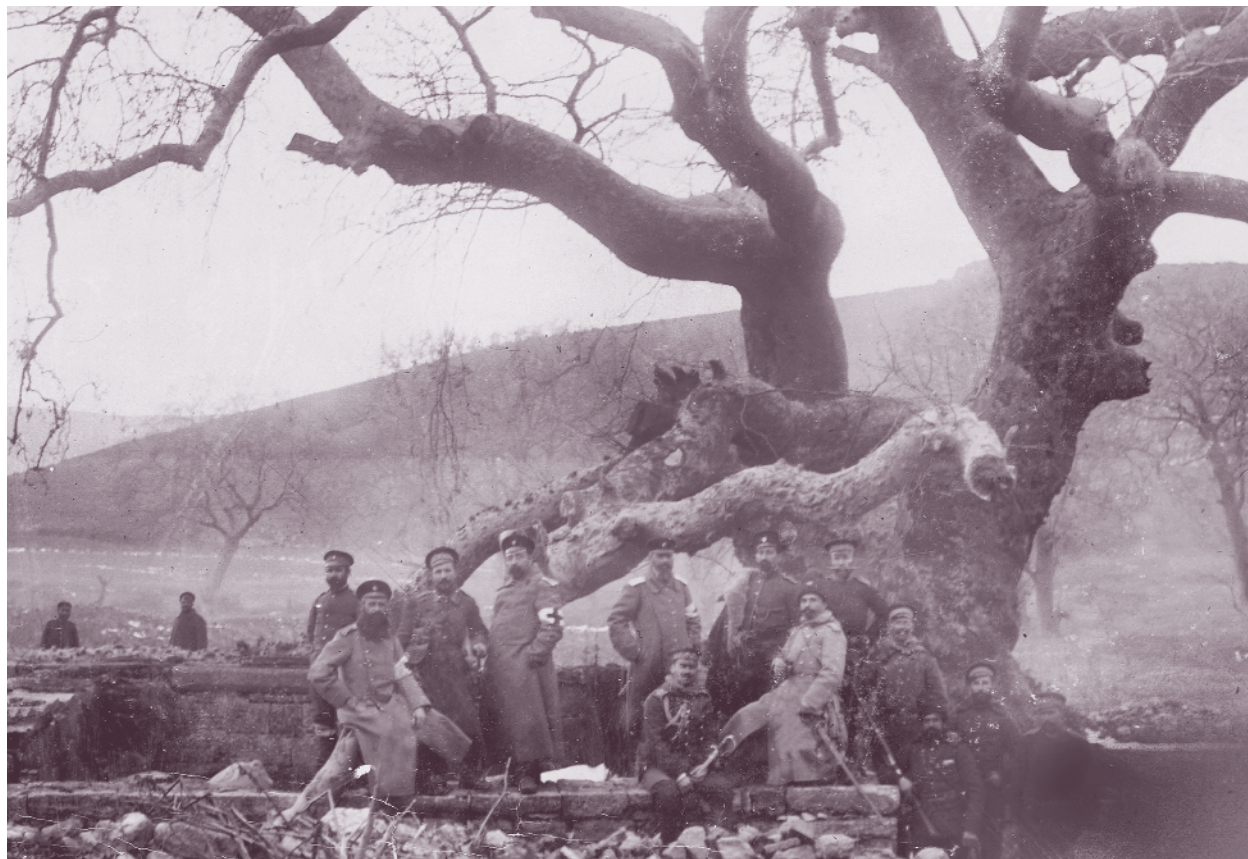
Щабът и медицинските лица на 44-ти пехотен полк, Чаталджанско, 12 януари 1913 г.

По време на Балканската война на 10 октомври 44-ти пехотен полк води кръвопролитни боеве срещу турците при Ески Полос и Петра. Турските дивизии са разбити и отстъпват безразборно към Люлебургаз. Пътят към Лозенград е открит и градът е превзет от полковете на Дунавската дивизия.