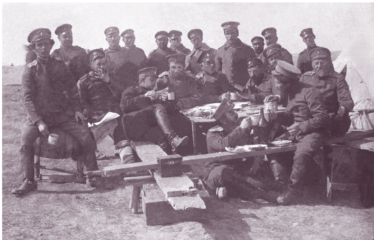
Офицери от 52-ри пехотен полк на обяд, с. Татаркьой, Одринско, 11 март 1913 г.

Под командването на полковник Васил Воденичаров полкът участва в Балканската война (1912–1913) . Той заема район за съсредоточаване в Харманли. Със започването на войната бригадата настъпва на турска територия в състава на маневрените войски. В боевете за Люлебургаз на 16 октомври 1912 г. 52-ри пехотен полк (заедно с 51-ви пехотен полк) отразява атаката на 15 дружини, настъпили между Марица и Арда в района на Епчели. Турците дават над 800 убити. На 25 октомври 52-ри пехотен полк (заедно с 12-и пехотен Балкански полк) участва в атаката на турските укрепени позиции на вис. Папаз мене.