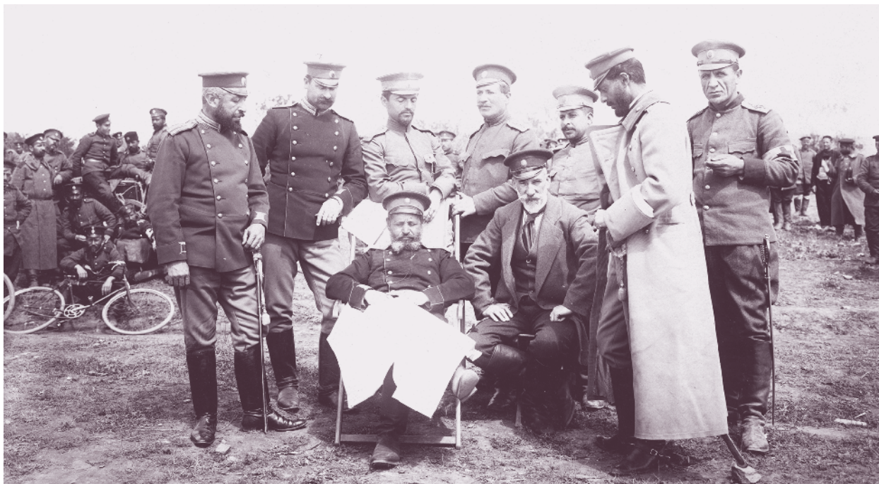
Офицери от 41-ви пехотен полк, гр. Дедеагач, 22 април 1913 г.

Трета Балканска бригада се оттегля в посока на Беласица и към 24 юни полковете започват да изкачват стръмните склонове на планината под артилерийски обстрел, но не успяват да достигнат до гребена ѝ. Бригадата отбранява левия фланг на позицията, а западно от нея е 2-ра Бдинска бригада. Срещу двете български бригади са хвърлени пет дивизии от западната група на противника. На 25 юни гърците атакуват в гъсти вериги неудобните за отбрана позиции на 3-та Балканска бригада. Оределите в предишните боеве нейни полкове със сетни сили удържат атаките. Гръцки части успяват да обхоят позициите на левия фланг и да проникнат до незаетия гребен на Беласица. Врачанският полк е изпратен в подкрепа на 3-та бригада, но и това не помага да бъде спряно настъплението на превъзхождащия ги многократно противник. По заповед на Главната квартира всички български части се оттеглят към Струмица, водейки боеве по северните склонове на Беласица и в долината на р. Струмешница. След това са пренасочени на позиции в Малешевската планина, северно от Пехчево. Гърците заемат водоела на Беласица и изпращат авангарди да ограничат изтеглянето на обозите на Четвърта армия по дефилето, но постигат частичен успех. Задачата на Втора армия да осигури изтегляне на обозите и артилерията на Четвърта армия към Петрич и Горна Джумая е изпълнена. Трета Балканска бригада влиза в оперативно подчинение на 6-а пехотна Бдинска дивизия и на 28 юни полкът участва в ариергардните боеве при с. Белица.