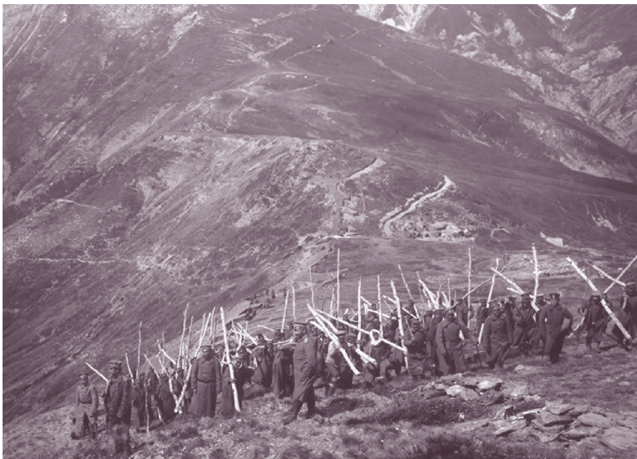
Шеста рота от 58-и пехотен полк пренася материали за изграждане на позиция, вр. Порта, Македония, 1916 г.