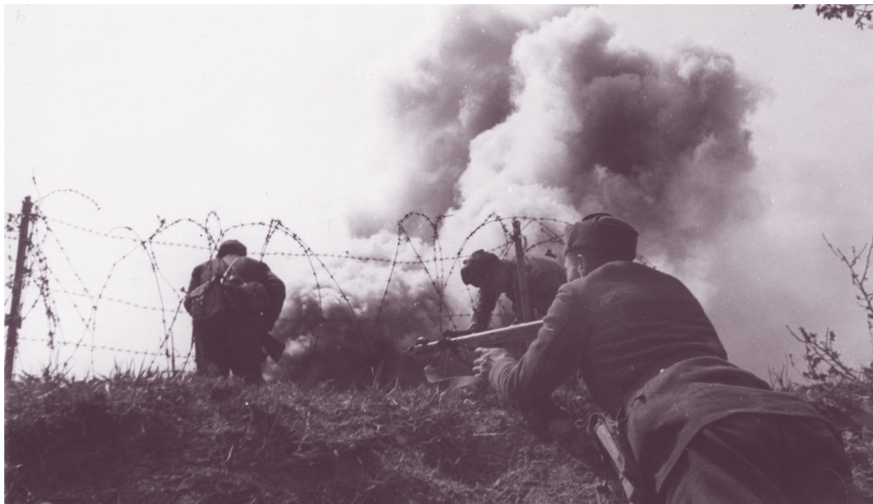
Воители от 42-ри пехотен полк водят бой

На 24 октомври преследването на противника е подновено, овладян е фортът Кохерлани на р. Дунав и настъплението продължава към Черна вода, като е достигнато с. Колакьой.