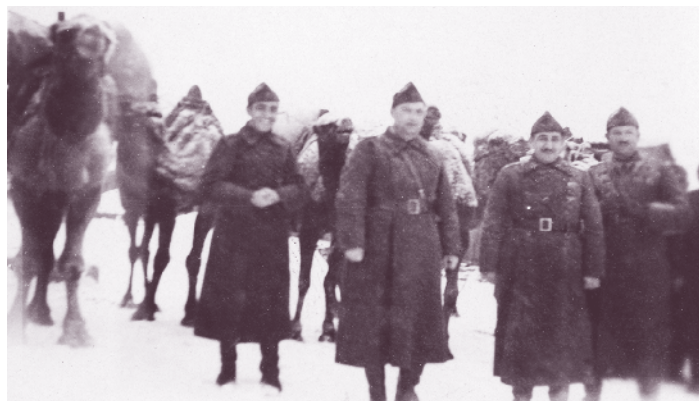
Офицери от 4-та дружина на 66-и пехотен полк, Дервиш могила, Свиленградско, зимата на 1943–1944 г.

Участва в отбранителните боеве на Планинската дивизия през септември 1918 г. на Вардарския участък от Дојранската позиция – източно от р. Вардар, като е в маневрените войски на дивизията. След излизането от войната през октомври с.г. 66-и пехотен полк се завръща в Кюстендил и е демобилизиран. През май 1919 г. той е разформиран.