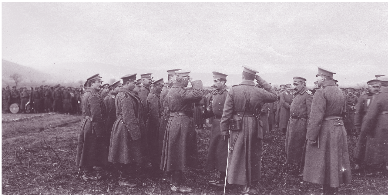
Офицери от 43-ти пехотен полк се представят на главнокомандващия генерал-майор Никола Жеков, 17 януари 1916 г.

За участие в Първата световна война (1915–1918) 43-и пехотен полк е формиран отново – от състава на 9-и пехотен Пловдивски и 21-ви пехотен Средногорски полк. Влиза в 3-та бригада от 2-ра пехотна Тракийска дивизия, която е под командването на полковник Лазар Козарев. Командир на полка е подполковник Христо Брайков. На Тракийската дивизия е разпоредено от 28 септември 1915 г. да поеме и годината на р. Струма, като смени там 14-и пехотен Македонски полк от Рилската дивизия. За целта 3-та бригада е предислоцирана в годината на Струма, а 43-ти пехотен полк сменя от позиции Македонския полк при с. Левуново. От 1 октомври до 30 ноември 1915 г. полкът отбранява участък на левия фланг на бригадата срещу тръгналите на струмишкото направление съглашенски войски. Боевете продължават от 21 до 30 октомври, като роти от 43-ти пехотен полк подпомагат 14-и и 44-ти пехотен полк, оказали се на направлението на главния удар на 156-а френска дивизия и 30-а английска бригада. Настъплението на съглашенските войски към Струмица е спряно и те преминават към отбрана.