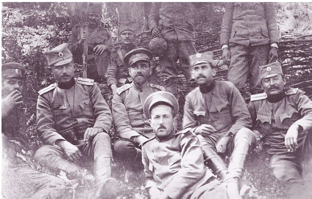
Офицери от 44-ти пехотен полк и сръбски офицери пред позициите при с. Узем, Кривопаланско, 25 юли 1913 г.

През септември 1915 г. в Пазарджик отново е формиран 44-ти пехотен полк – от състава на 27-и пехотен Чепински и 28-и пехотен Стремски полк. Негов командир е подполковникът от ГЩ Иван Бочев. Участва в Първата световна война (1915–1918) в състава на 3-та бригада от 2-ра пехотна Тракийска дивизия. Първоначално тя е в резерв на Главното командване и нейни части са изпратени в Неврокопско за прикритие на южната граница. От 28 септември на Тракийската дивизия е разпоредено да поеме и долината на р. Струма, като смени там 14-и пехотен Македонски полк от Рилската дивизия. За целта 3-та бригада е предислоцирана в долината на Струма, като 44-ти пехотен полк до 3–4 октомври заема района при с. Белица. В началото на октомври той се изправя срещу англо-френски войски, дебаркирали в пристанището на Солун и настъпващи на север по долината на Вардар, за да окажат помощ на разгромената и отстъпваща сръбска армия. На 19 октомври полкът влиза в състава на Сборната бригада – заедно с 14-и пехотен Македонски полк и 43-ти пехотен полк. Бригадата под командването на полковник Лазар Козарев заема участък за отбрана от Конче планина до гръцката граница. Участъкът на 44-ти полк е на левия фланг на бригадата – от поста Злешево до гръцката граница. Вдясно от него е 14-и Македонски полк.