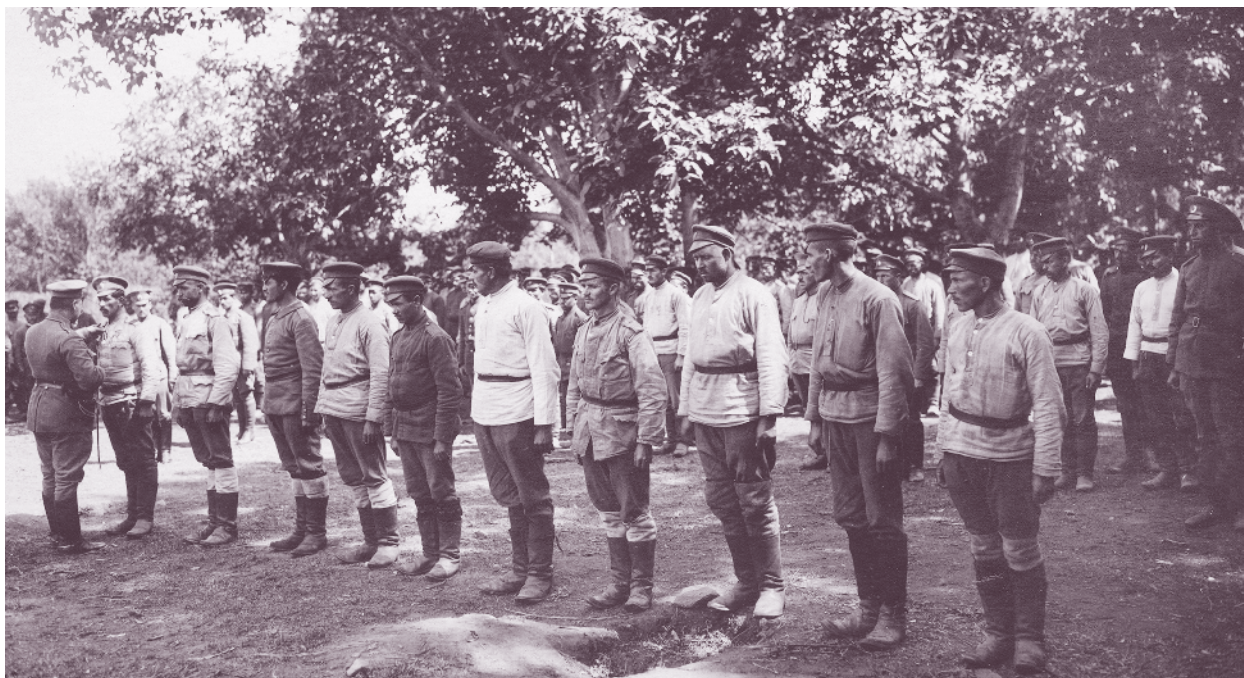
Награждаване на войници от 10-а рота на 64-ти пехотен полк за пленяване на английски офицер през Първата световна война

Командирът на Македонската дивизия изпраща спешно до полковник Бурмов: „Разпоредете частите ви да развеят знамената и с музиката да тръгнат напред“. Полковник Христо Бурмов лично повежда атаката на 54-ти и 6-и пехотен полк. Под звуците на „Шуми Марица“ веригите яростно атакуват френските позиции, но отново са отблъснати от плътния огън на противника.