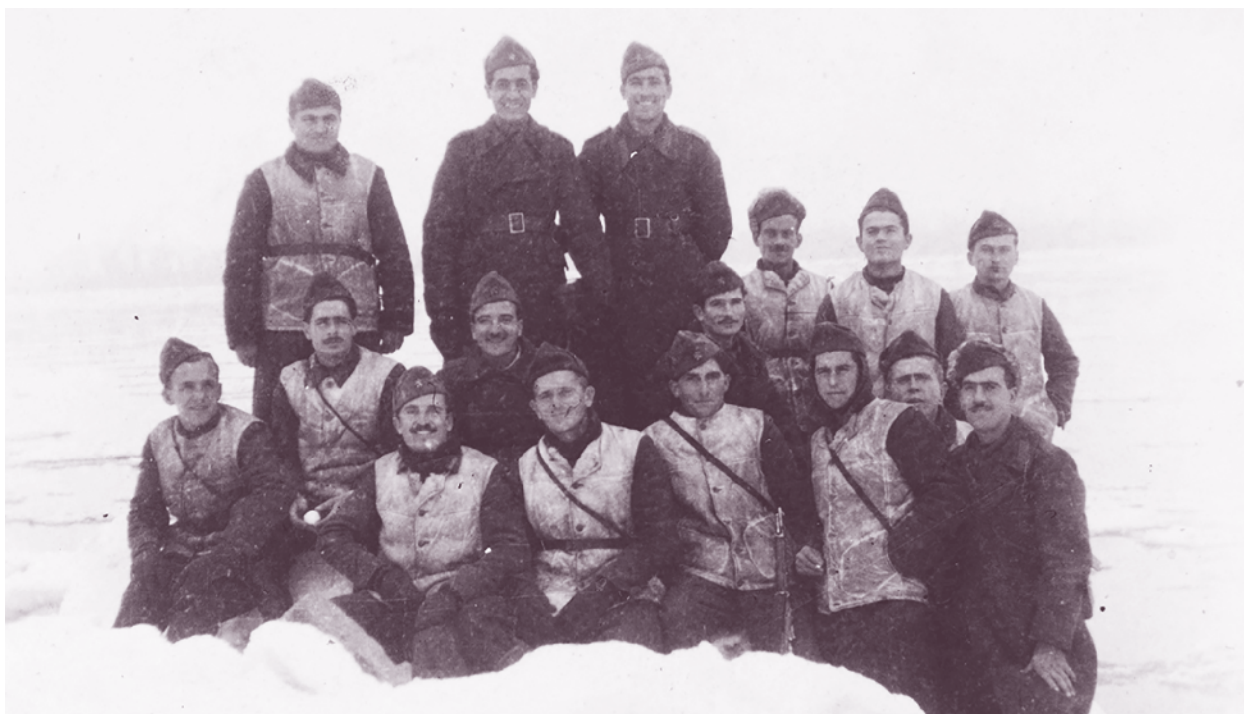
Войници от 1-ва тежкокартечна рота на 59-и пехотен полк, 1945 г.