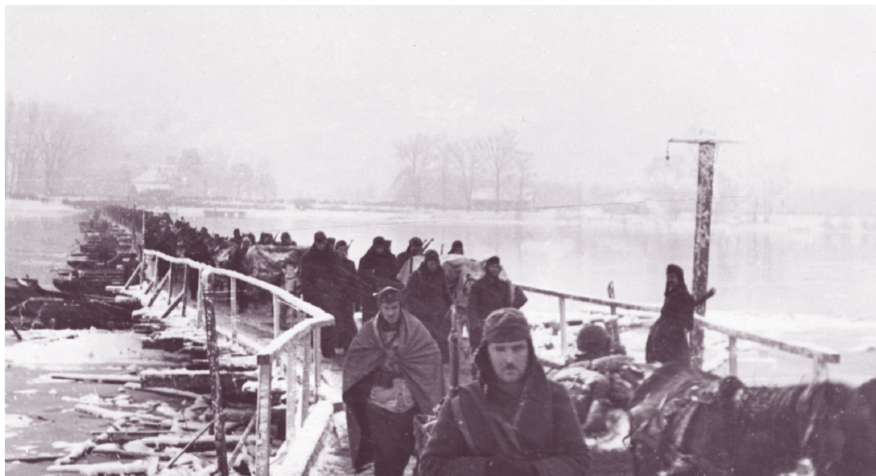
Четиридесет и втори пехотен полк преминава р. Дунав по понтонен мост при гр. Илок, Хърватия, 1945 г.

Двата пехотни полка – 42-ри и 41-ви, се редуват в авангарда на бригадата, като продължават да преследват противника. До 17 декември достигат с. Дойчещи. Врагът се оборудва за отбрана на линията Филмул – Гюргени с намерението да гаде решително сражение и да спре настъплението към р. Серет. От 26 до 29 декември се водят жестоки боеве с румънски и руски части около Гюргени – по двата бряга на р. Калмацуул, придошла от непрестанните гъжгове и превърнала местността в блато. Полковете на бригадата настъпват неугържимо. Вдясно от нея настъпва 26-а турска дивизия. Противникът се сражава отчаяно, но не издържа и се оттегля, а 42-ри полк започва преследване към Корбул. През януари 1917 г. е сменен командирът му и командването е поето от полковник Александър Ганчев. На 18 януари полкът сменя 25-и Драгомански полк на позициите му при Корбул и остава там до 2 февруари, когато е сменен от 16-и Ловчански полк. В студената зима получават измръзвания 155 войници от полка.