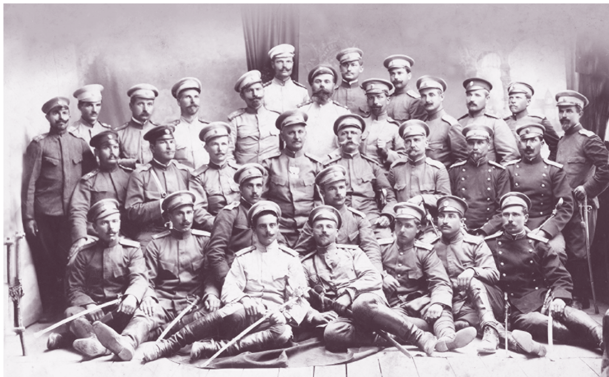
Офицери от 70-и пехотен полк, 1913 г.

Формиран е на 17 април 1913 г. от 1-ва дружина на 52-ри пехотен полк в навечерието на Междусъюзническата война (1913 г.) и е включен в състава на новосформираната Драмска бригада от Втора армия. Без достатъчна подготовка, на 21 юни 1913 г. две дружини от полка са изпратени в помощ на 1-ва бригада от 10-а пехотна дивизия, сражаваща се при Лакна срещу три гръцки дивизии. Двете дружини прикриват оттеглянето на българските части, докато и последната дружина се прехвърли при моста на Орляк на левия бряг на Струма, след което се оттеглят на 22 юни сутринта и заемат позиции във втората линия на отбраната на южния изход на Рупелското дефиле. Противникът обаче я пробива, българските войски отстъпват и се развърщат на позиции на южния изход на Кресненското дефиле. Драмската бригада е в първата линия на отбраната на левия бряг на р Струма – в района на Градешница.