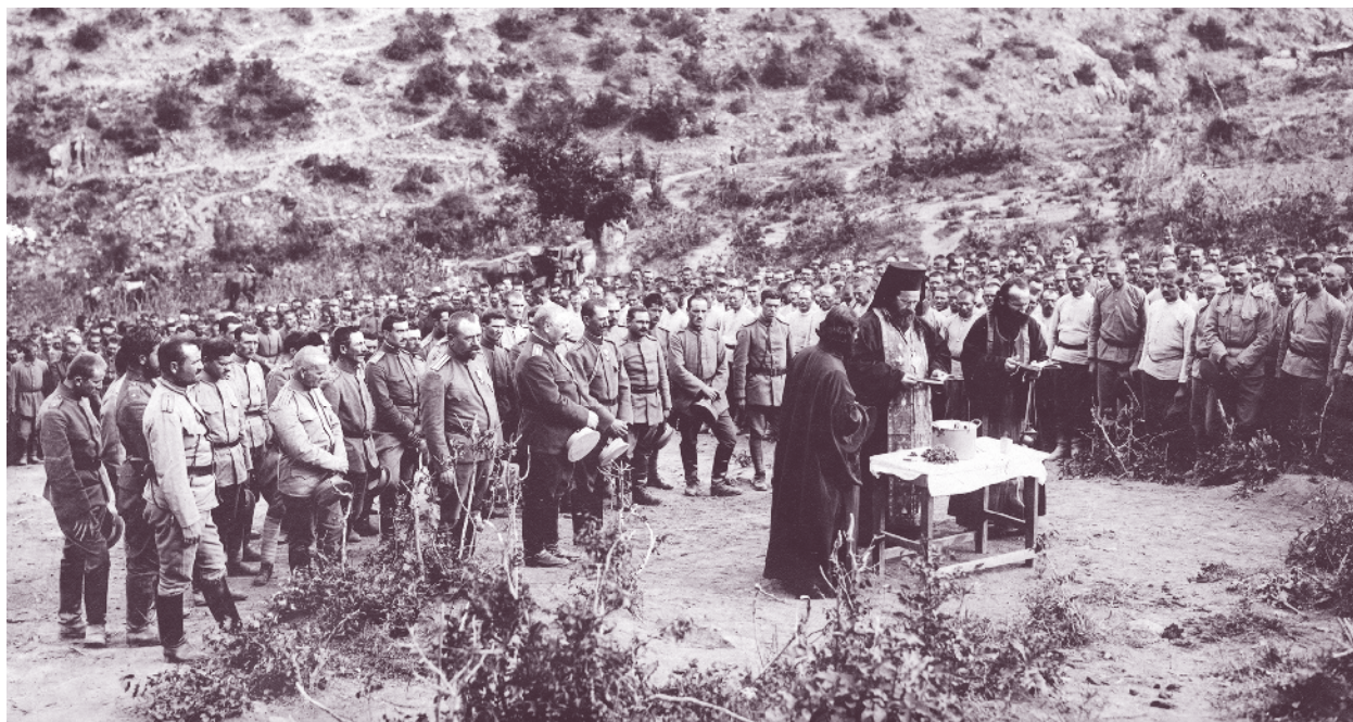
Молебен на фронта в 61-ви пехотен полк от 11-а пехотна Македонска дивизия, 1917 г.