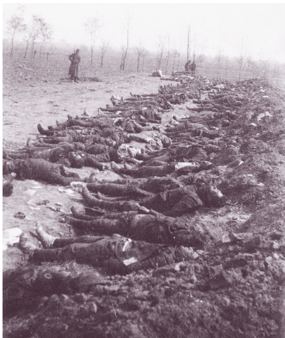
Панихида в 59-и пехотен полк, село Драва Чехи, Унгария, 1945 г.