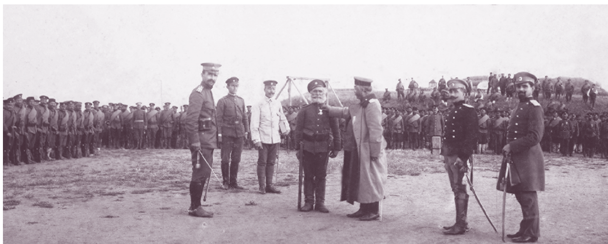
Раздаване на награди на отличилите се от 58-и пехотен полк, Каук табия, Огринска крепост, 1913 г.

Полкът участва в окончателното сключване на обсадата около Огринската крепост и в щурма за превземането ѝ. На 11 март започва интензивна артилерийска подготовка по укрепленията на предната позиция. Атаката на пехотните полкове е през нощта на 12 март, като 58-и пехотен полк атакува на запад от Серван дере. Българската артилерия с масиран огън подкрепя атаката на пехотата, като принуждава тази на противника да замлъкне.