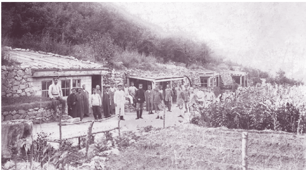
Войници от 60-и пехотен полк в лазарет на 11-та пехотна Македонска дивизия, местността Гьолчука, Македония, 1918 г.

През юли 1917 г. при преименуването на Македонската дивизия в 11-а пехотна 2-ри пехотен Македонски полк става 60-и пехотен полк. Негов командир е полковник Стоян Калоянов. Първа пехотна бригада, включително 60-и пехотен полк, взема участие в ожесточените боеве през септември 1918 г. при Дойран, като заема за отбрана участъка от Дойранското езеро до Беласица планина. Командир на бригадата е полковник Панев. Срещу нейните части настъпва 16-и британски корпус. Противникът атакува укрепените позиции на македонските полкове, развърщайки пехотата и артилерията си в открито поле, под огъня на българската артилерия.