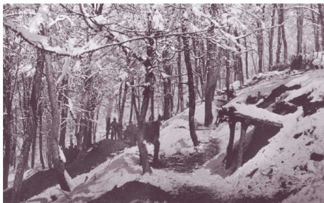
Землянки на 53-ти пехотен полк в Битолско през Първата световна война

През 1915 г. полкът участва в боевете в Македония. Със започването на войната 7-а Рилска дивизия действа в направление Царево село – Кочани – Щип – Велес. На 2 октомври 53-ти полк настъпва през Голак планина към Веница. Билото ѝ е укрепено от сръбските части, включително с блиндирано окопи. От разположената западно от с. Драгобрац височина и западно от с. Пекляно настъпващите вериги на българите са обстрелвани с артилерия и картечници. С вихрени атаки „на нож“ дружините от 3-та Рилска бригада успяват да изтласкат сърбите от билото. На следващия ден частите на 7-а Рилска дивизия овладяват Калиманското плато и се спускат в Кочанското поле. Югозападно от Гърляно с противника води бой 53-ти полк, достига Якимово и оказва подкрепа на 54-ти пехотен полк в боя му при с. Драгобрац. Сърбите напускат позициите си и се оттеглят към Веница, преследвани по петите от рилските полкове. На 5 октомври 53-ти пехотен полк води бой при кота 550, а на следващия ден пада Страцинската позиция, превзета от 3-та Балканска дивизия, и рилските полкове настъпват към Куманово. Пет сръбски полка са разпилени под удари-