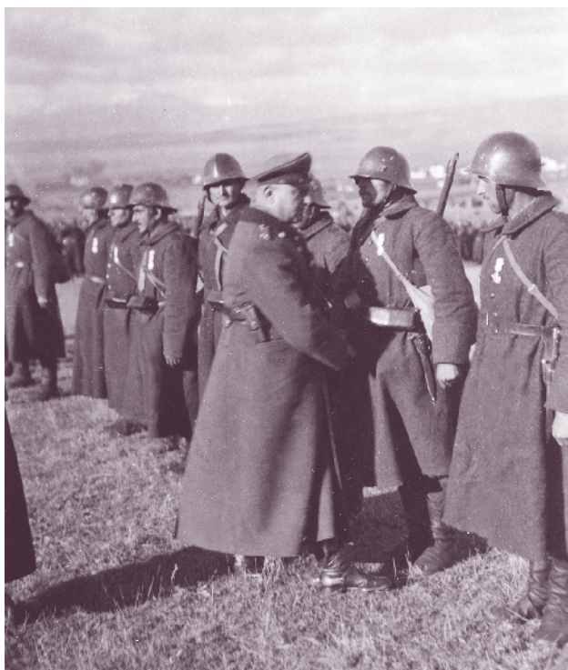
Награждаване с ордени „За храброст“ в 44-ти пехотен полк, 1945 г.

на линията с. Градешница, вр. Яребична, вр. Цар Фердинанд, Тунджански гребен, която отстои на 6–8 км от първата позиция. Там вече се намират оцелелите от отстъпилата 1-ва бригада на 8-а Тунджанска дивизия, които заемат позиции на вр. Голям козяк. Загубите в жива сила са огромни, като липсва и почти цялата артилерия.