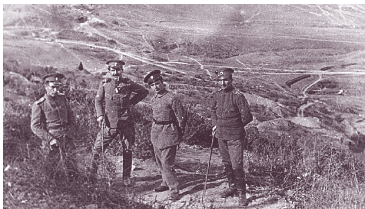
Офицери от 57-и пехотен полк, Дойрански позиции, 18 април 1917 г.

на левия бряг на р. Свърлишки Тимок. От 20 до 22 октомври гружините от 57-и пехотен полк с подкрепата на 58-и и 34-ти Троянски полк разбиват противника при прохода Грамага – последната силна позиция на сърбите, защитаваща гр. Ниш. Боевете при Дервент, Гравище и Грамага са наблюдавани от сръбския крал Петър, станал свидетел на погрома на сръбските войски. Пътят на българските полкове към Ниш е открит. На 23 октом-