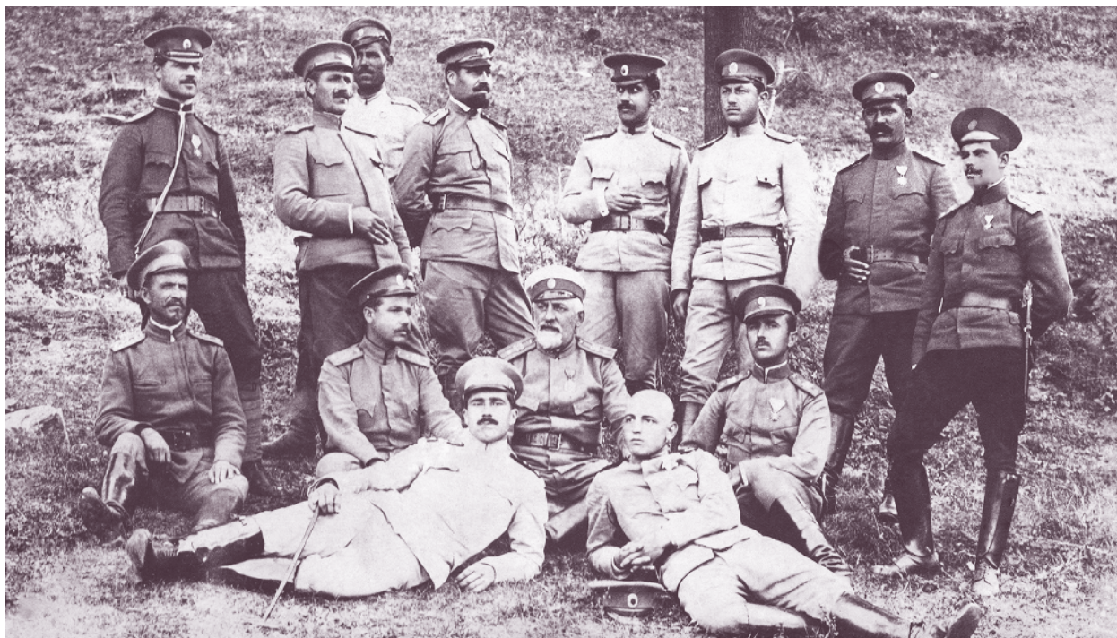
Офицери от 55-и пехотен полк през Първата световна война

Участва във Втората балканска война (1913 г.) в състава на 11-а пехотна дивизия и води бойни действия по течението на р. Места срещу гърците при Неврокоп и в Разложкото поле. Участва в решителния бой с гръцките части на Предела, изпратени да спрат настъпващите от Самоковския и Родопския отряд във фланг на основната гръцка групировка, разположена в Кресненското дефиле. Напредването на гърците е спряно и българските части се надвесват над дефилето, като така завършват обкръжаването на гръцката армия от изток. Сключеното примирие я спасява от пълен разгром. След войната през август 1913 г. полкът е демобилизиран.