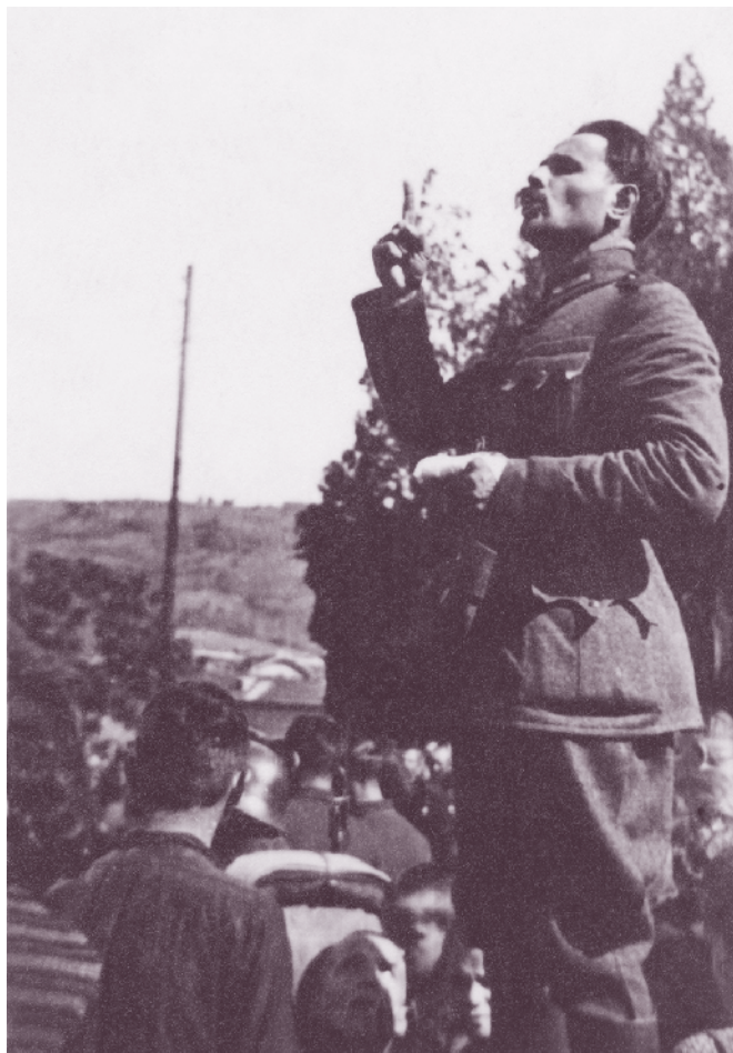
Полковник Васил Демиревски (Жельо) – командир на 3-ти гвардейски полк, говори на митинг в Кюстендил, 1944 г.

През декември 1944 г. полкът се завръща в родината и се установява на гарнизон в София. На основание на Заповед № 2 от 17 януари 1945 г. той е трансформиран в 3-та гвардейска допълваща дружина. С Указ № 17 на регентите от 7 август 1945 г. е преместен в Ботевград. При обединяването на двете софийски дивизии съставът на 3-ти пехотен гвардейски полк се влива в 1-ви пехотен Софийски полк и дружината от 25-и пехотен полк, дислоцирана в Ботевград.