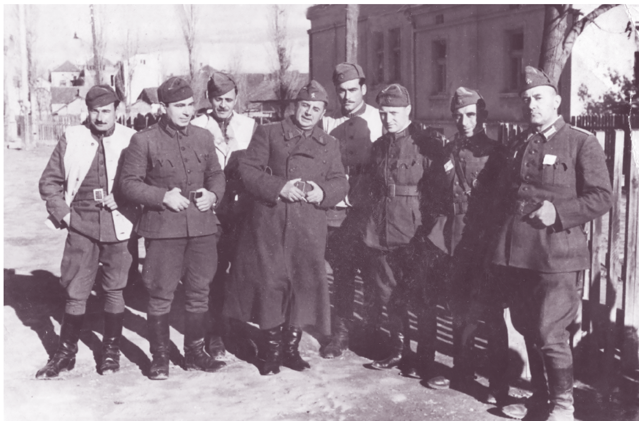
Офицери от щаба на 46-и пехотен полк в с. Неметланд, Унгария, 1945 г.