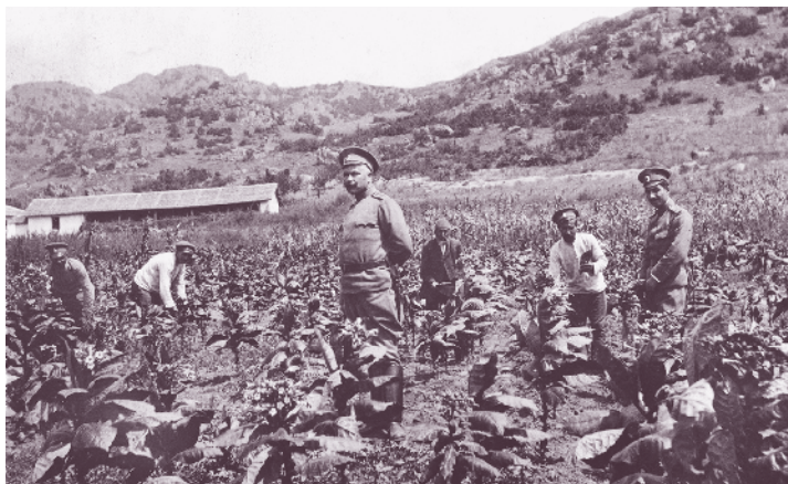
Войници от 48-и пехотен полк берат тютюн през Първата световна война

прехвърлени в състава на Пета армия и участват в боевете на кюстендилското направление и в Кресненската операция за обкръжаване на гръцката армия. Останалите две дружини на полка се оттеглят към България след настъплението на турската армия през демаркационната линия на 30 юни 1913 г. и водят кратки артилерийски боеве. Полкът е демобилизиран и разформиран през август 1913 г.