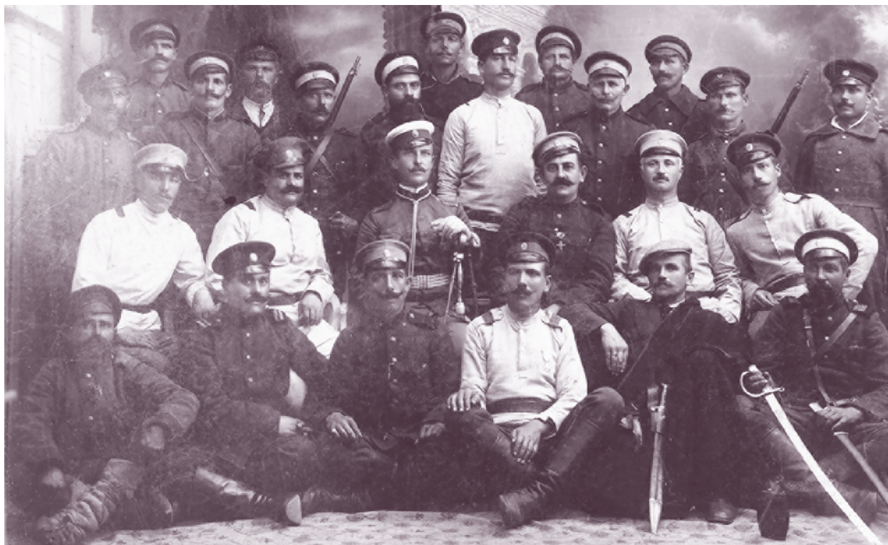
Персоналът по прехраната на 37-и пехотен полк през балканските войни (1912–1913)

На 5 юли командването на Трънския отряд е поето от командира и щаба на 5-а пехотна Дунавска дивизия и настъплението е възобновено, а 37-и пехотен полк изпълнява задачи за заслоняване основната групировка на отряда от удари във фланг откъм Дъсчен кладенец и Калиски Тумби в направление на Зелени град и Рани лист. Полкът настъпва на 11 юли и до 18 юли води боеве за върховете Църна трава, Въртоп, Криводял и Калиски Тумби. Уплашени от настъплението на Трета армия, сърбите подвеждат снети от главното направление силни резерви към Царево село и успяват да го спрат. На тези позиции дружините на 37-и пехотен полк дочакват примирието и несправедливия Букурещки договор.