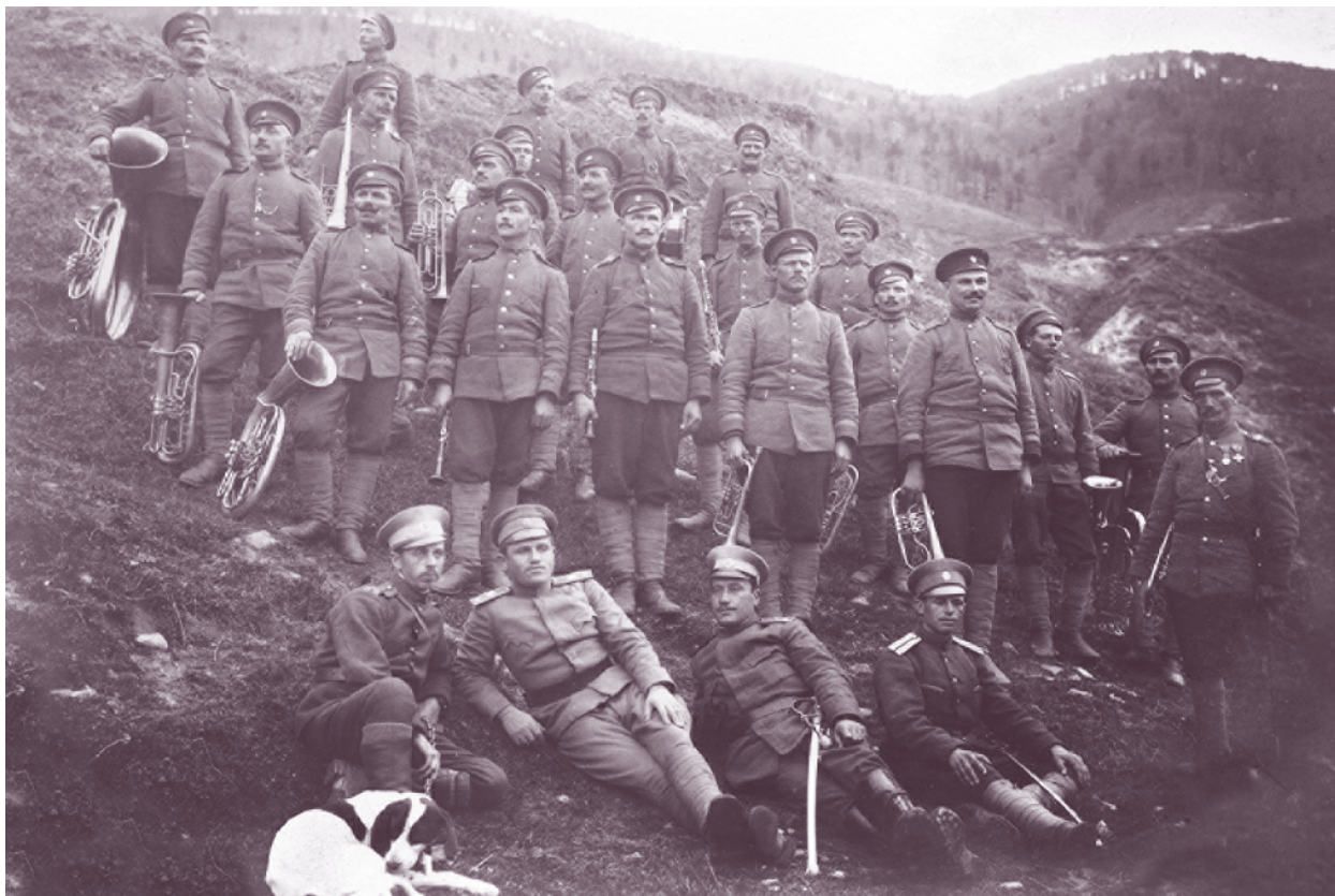
Музикантската команда и офицери от 56-и пехотен полк през Първата световна война

Призори на следващия ден, към 4 ч., пехотата от всички сектори безшумно и незабелязано се вдига към позициите на противника. Преди уречения час настъпват дружините от 56-и пехотен полк и в 4:30 ч., след като са прогонили постовете на неприятеля по Провадийска река, атакуват „на нож“ окопите от предната позиция. Овладеана е, но полковете са спрени от убийствения огън на турската артилерия и се окопават.