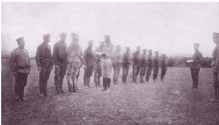
Награждаване с ордени „За храброст“ в 57-и пехотен полк край с. Милетково, Гевгелийско, 24 април 1916 г.

От 10 до 13 октомври полкът води боеве на десния бряг на р. Тимок за върховете Китка и Гравище, в обход на главните сръбски позиции на масива Могра стена, където дава нови свидни жертви и взема 143 пленници. Заплашени от обходните действия на 3-та Плевенска бригада, сърбите се оттеглят от укрепената линия по Свърлишка планина. Дружините от полка продължават настъплението, като от 15 до 18 октомври водят тежки боеве при с. Бордимо, кота 557 и с. Извор. На следващия ден полкът се сражава източно от с. Дервент – за кота 580 и кота 370. Противникът е отхвърлен с големи загуби