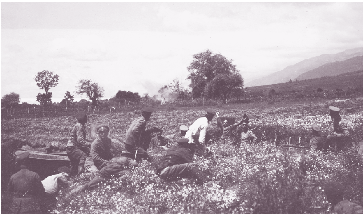
Обучение с гранатохвъргачки в 64-ти пехотен полк през Първата световна война

Формиран е на 13 май 1913 г. в с. Суходол, Софийско, от 3-та дружина на 54-ти пехотен полк, 9-а, 21-ва и 28-а допълваща дружина – като 6-и пехотен резервен полк. Впоследствие е преименуван на 64-ти пехотен полк и е включен в състава на 13-а пехотна дивизия от Трета армия. Взема участие във Втората балканска война (1913 г.) и води боеве при Славена, Патернаш и Черни връх. След войната през август е демобилизиран и от кадровия му състав е формиран 40-и пехотен полк, който в състава на 10-а пехотна Беломорска дивизия участва в администрирането на Беломорието.