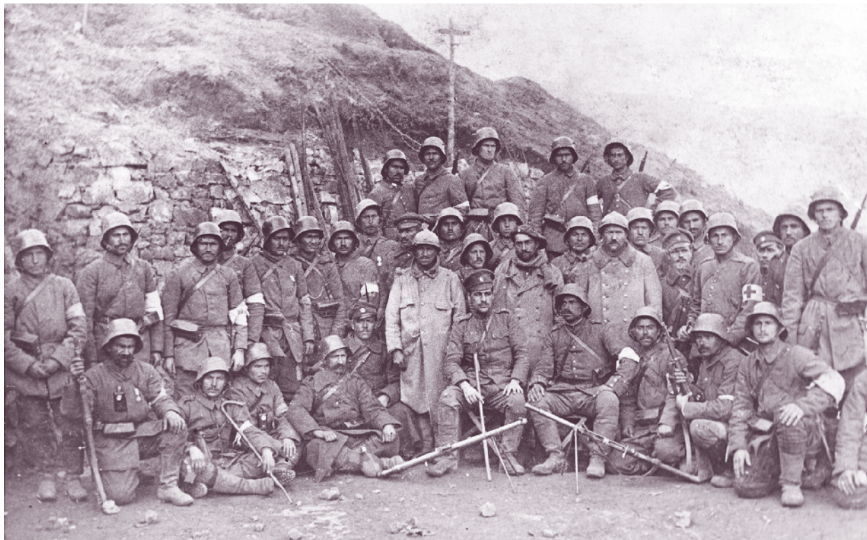
Щурмова група от 81-ви пехотен полк със заловени пленници французи през Първата световна война

През септември 1918 г. в хода на решителното настъпление на съглашенците на Доброполския участък полкът е изведен от състава на дивизията в резерв на 62-ри армейски корпус. По време на боевете той е включен в сборна българска бригада, съставена от останалите боеспособни от 53-ти и 81-ви пехотен полк, която е част от сборната дивизия на генерал Фон Ройтер, поел командването на всички части в участъка на пробива. Полкът заема позиции на втората линия на отбраната на Козяците. Двете дружини от 81-ви полк под началството на полковник Шингаров са на най-важните височини Голям Козяк и Голяма бригадна. През цялата нощ срещу 16 септември противникът обстрелва позицията на Голям Козяк, за да не позволи да се работи за укрепяването ѝ. Едновременно през нощта той се доближава до подножието на новата позиция на полка и още на разсъмване, в 5:30 часа, атакува, като иска да овладее позицията с изненада, без артилерийска подготовка.