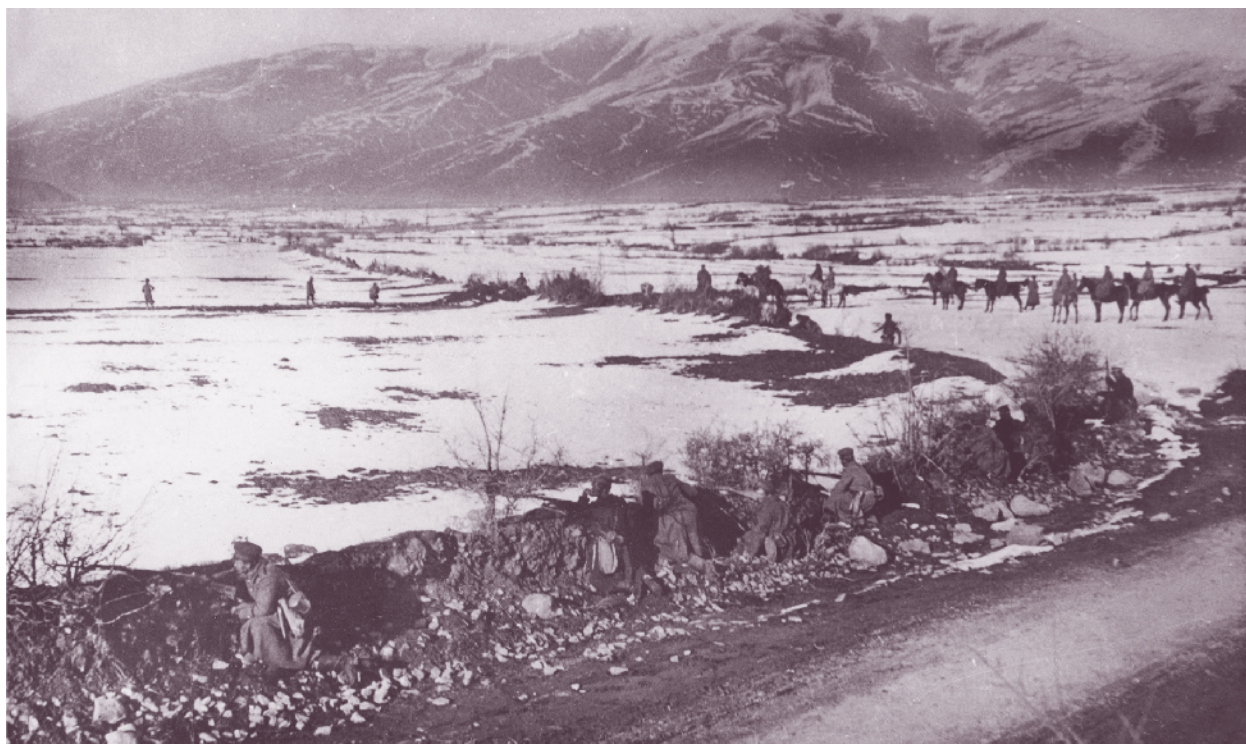
Позиции на 53-ти пехотен полк през Първата световна война при с. Алинци, Прилепско

През 1915 г. полкът участва в боевете в Македония. Със започването на войната 7-а Рилска дивизия действа в направление Царево село – Кочани – Щип – Велес. На 2 октомври 53-ти полк настъпва през Голак планина към Веница. Билото ѝ е укрепено от сръбските части, включително с блиндирано окопи. От разположената западно от с. Драгобрац височина и западно от с. Пекляно настъпващите вериги на българите са обстрелвани с артилерия и картечници. С вихрени атаки „на нож“ дружините от 3-та Рилска бригада успяват да изтласкат сърбите от билото. На следващия ден частите на 7-а Рилска дивизия овладяват Калиманското плато и се спускат в Кочанското поле. Югозападно от Гърляно с противника води бой 53-ти полк, достига Якимово и оказва подкрепа на 54-ти пехотен полк в боя му при с. Драгобрац. Сърбите напускат позициите си и се оттеглят към Веница, преследвани по петите от рилските полкове. На 5 октомври 53-ти пехотен полк води бой при кота 550, а на следващия ден пада Страцинската позиция, превзета от 3-та Балканска дивизия, и рилските полкове настъпват към Куманово. Пет сръбски полка са разпилени под удари-