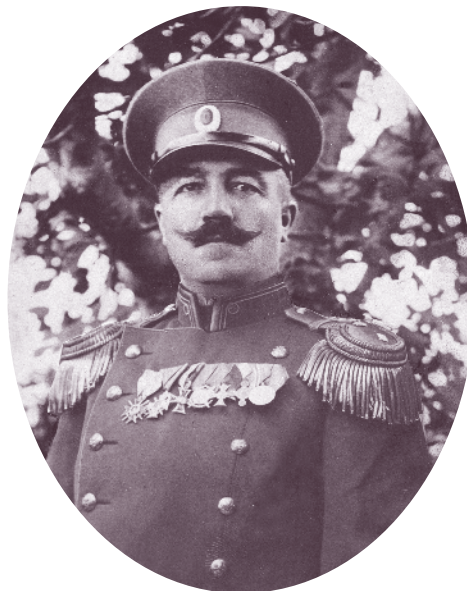
Командирът на 40-и пехотен полк полковник Димитър Славчев, ранен при Завоя на р. Черна, починал на 17 ноември 1916 г. в гр. Прилеп

В Първата световна война (1915–1918) 40-и пехотен Беломорски полк воюва в състава на 2-ра бригада от 10-а пехотна Беломорска дивизия. През 1915 и 1916 г. участва в отбраната и охраната на гр. Дедеагач, на морския бряг от с. Макри (Макренската позиция) до устието на Марица. През август е в Струмската настъпателна операция на Втора армия, като настъпва в състава на дивизията и стига до устието на Струма в Сароския залив.