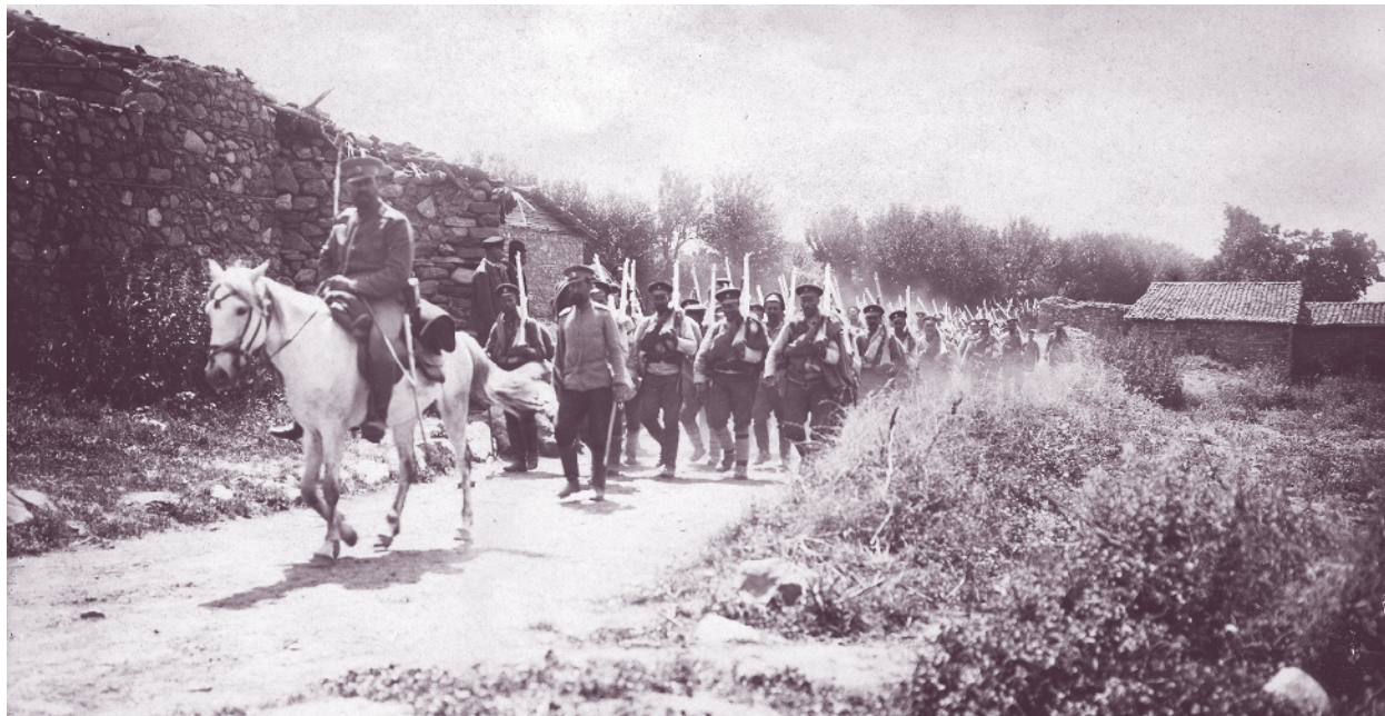
Четиридесет и първи пехотен полк в поход, село Долни Порой, Демирхисарско, 23 май 1913 г.

Героичните воители от 3-та Балканска бригада 25 дни под командването на произведения посмъртно генерал-майор Каварналиев, с подкрепата на 2-ра Бдинска бригада, спират настъплението на четири гръцки дивизии и спасяват от погром, клане и опожаряване българите в Югоизточна Македония.