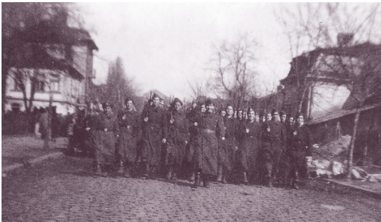
Маршировка на 1-ва рота от 1-ви гвардейски полк при завръщането ѝ от фронта, ул. „Цар Симеон“, София, 1944 г.

На 22 септември Главното командване поставя на дивизията задача да отдели един отряд и да го изпрати на Втора армия за охрана на нейния ляв фланг. В него са включени 1-ви гвардейски пехотен полк (без артилерия), усилен с един пионерно-щурмови взвод. Отрядът наброява 1258 души. До 28 септември се изнася в района на Сводже – Деян и още същия ден съвместно с погрозделение на югославските партизани води бой при Власотинци (днес е в Сърбия). Той продължава до обяд на 29 септември, когато немците не издържат на атаките и напускат града. Противникът се оттегля западно от р. Морава. Впоследствие две гружини от 1-ви гвардейски пехотен полк от 9 до 13 октомври участват в боевете за гр. Сурдулица. Решителното сражение започва на 13 октомври сутринта. След силна артилерийска и авиационна подготовка гружините от полка атакуват индустриалната част на града. Противникът не издържа на удара, пробива обръча в участъка, където действат югославски партизани, и се оттегля към р. Морава, а след това – към Враня и Бояново.