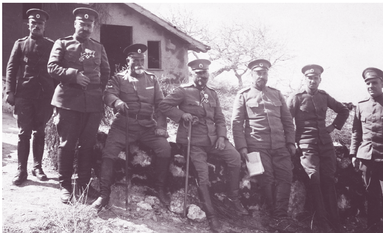
Офицери от щаба на 40-и пехотен полк в планината Кара баир, 18 април 1918 г.