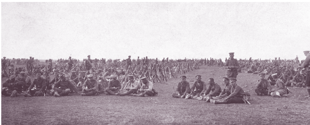
Петдесет и трети пехотен полк в почивка, Добруджа, 10 септември 1916 г.

След кратка почивка на 13 октомври полковете на 7-а Рилска дивизия са пренасочени на юг – към Щип и Велес, срещу съглашенските войски, бързащи на помощ на разгромената сръбска армия. След овладяването им 53-ти полк участва в отбранителните боеве срещу настъпващите френски, английски и сръбски войски. На 17 октомври той е преподчинен на командира на 2-ра бригада от Рилската дивизия полковник Дионисий Писинов и настъпва по десния бряг на р. Вардар. Настъплението на съглашенските войски е спряно и българските войски преминават в контранастъпление, довело до отхвърляне на врага южно от р. Черна, където полкът е сменен на позициите му и преминава в резерв. След двумесечни непрекъснати боеве поочуканият и с оредял състав 53-ти пехотен полк е на Южния фронт на р. Черна, където се подготвя за отбрана.