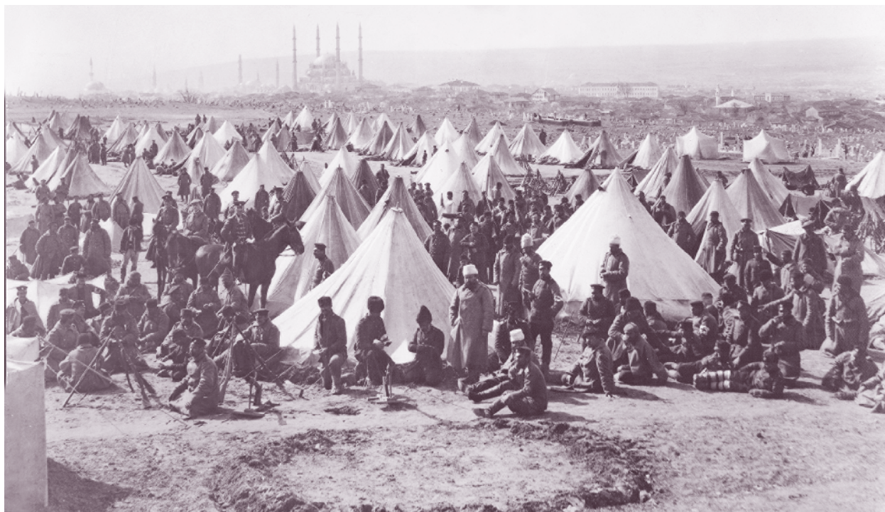
57-и пехотен полк в превзет турски бивак, Одрин, 13 март 1913 г.

Атаката на пехотните полкове започва през нощта на 12 март, като 57-и пехотен полк атакува на запад от Серван дере. Българската артилерия с убийствен огън подкрепя атаката, като принуждава противника да замлъкне. В нощната атака, приключила към 7–8 ч. сутринта, предната отбранителна позиция в Източния сектор е овладяна, противниковите бойци са прогонени, избити или пленени, голяма част от картечниците и артилерията е унищожена или взета като трофей. През нощта срещу 13 март започва атаката на главната фортова позиция. Одрин пада, войната е спечелена, но гружините от 57-и пехотен полк вместо почивка ги очаква нова война. Той е прехвърлен в Източна Македония и участва в боевете с гръцките войски в поречието на р. Места. На 13 август се завръща в Татар Пазарджик, където е демобилизиран.