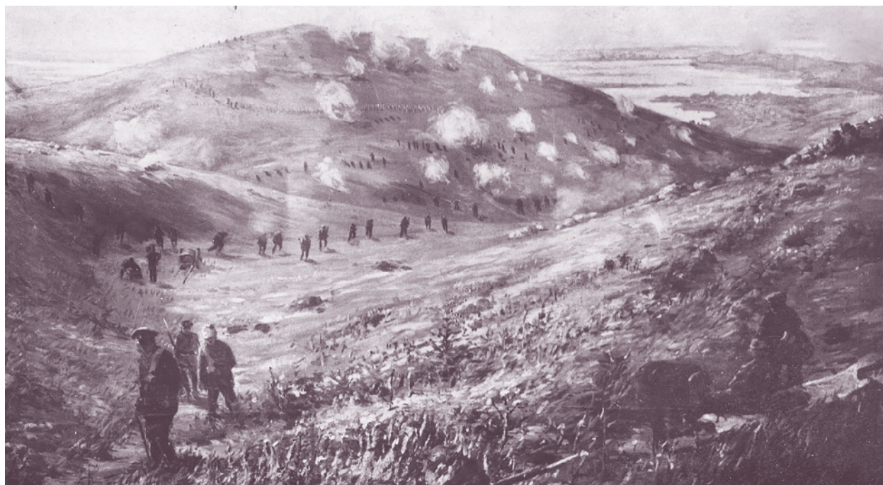
Четиридесет и осми пехотен полк атакува кота 166, 1916 г.

След прекратяване на примирието с Турция през януари 1913 г. е разположен на позиция срещу Чаталджанската укрепена линия. Води боеве при Арнауткьой за парирание опитите на турците да пробият нашата отбрана. Части от полка участват в подгържането на отбраната на Булаирската позиция.