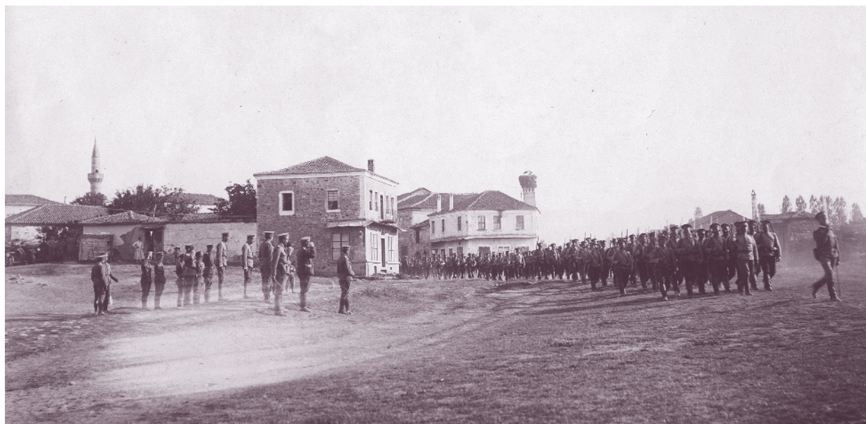
Генерал-майор Никола Жеков прави преглед на дружина от 39-и пехотен полк в село Йенидже, Ксантийско, 15 юни 1916 г.

В Първата световна война (1915–1918) през 1915–1916 г. 39-и пехотен Солунски полк под командването на подполковник Михаил Петров в състава на 10-а Беломорска дивизия охранява Беломорския бряг и пограничната линия по р. Места. През август 1916 г. участва в Струмската настъпателна операция на Втора армия. До 23 август частите на дивизията изпълняват напълно поставените им задачи. След излизането си на Егейското крайбрежие полкът охранява Беломорския бряг в района на Орфанския залив.