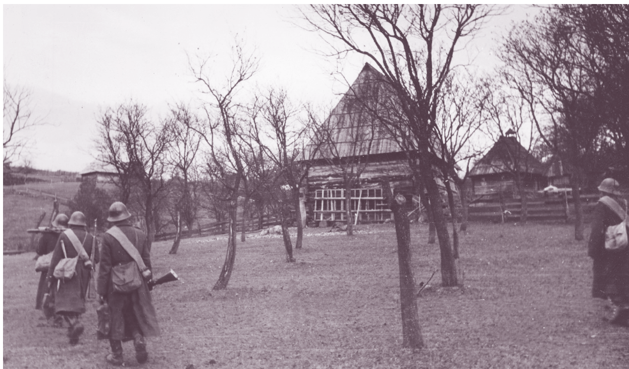
Войници от 46-и пехотен полк в австрийско село, 1945 г.