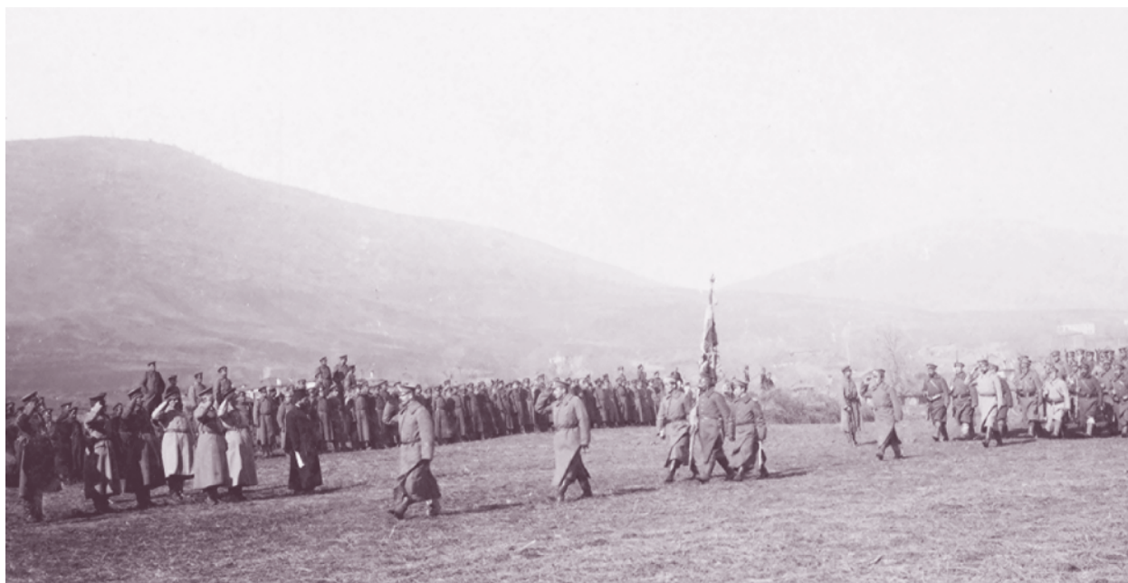
Командирът на 56-и пехотен полк приема парада на полка си, командван от командира на 1-ва дружина подполковник Витанов, край с. Търновче, Битолско, 27 февруари 1917 г.

През нощта срещу 13 март започва щурмът на главната фортова линия на крепостта. Дружините от 56-и пехотен полк настъпват в пространството между фортовете Айваз баба и Таш табия. В 1:50 ч. на 13 март те се вдигат на решителна атака и с подкрепата на част от 54-ти пехотен полк след яростен бой форт Таш табия е взет.