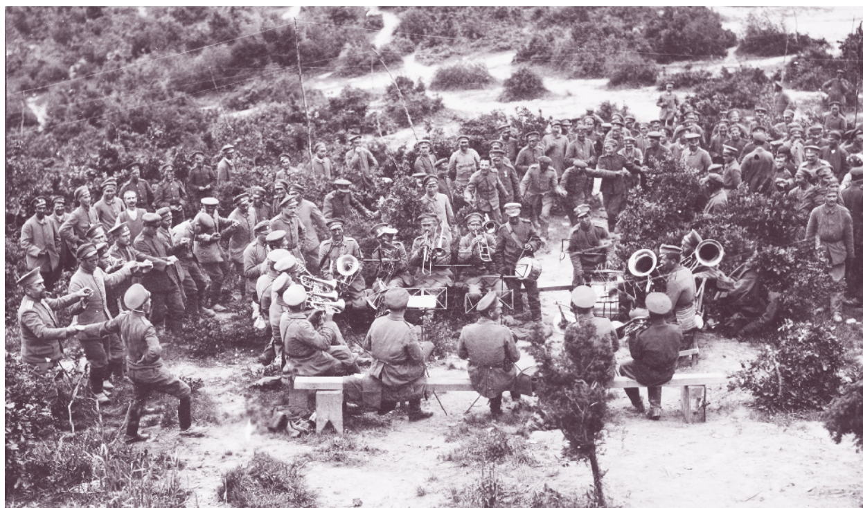
Веселие в 61-ви пехотен полк през Първата световна война