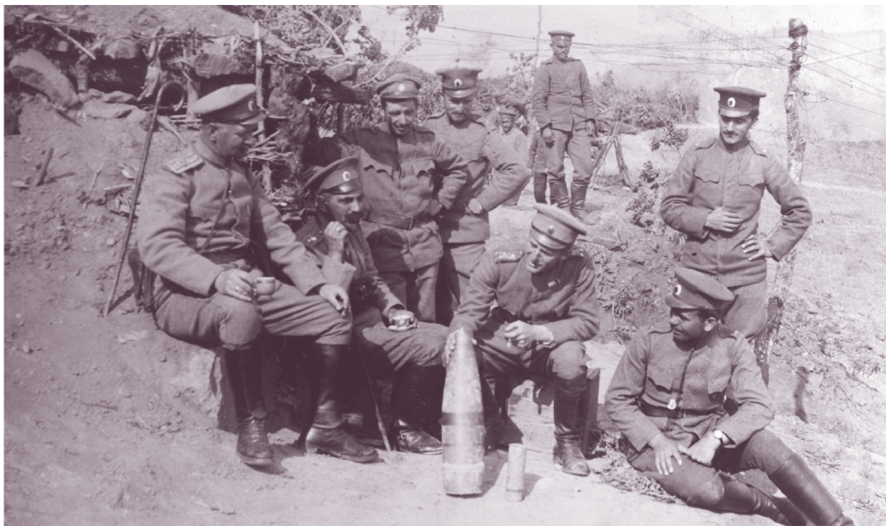
Разглеждане на френски снаряжи край наблюдателния пункт на 72-ри пехотен полк, Албания, 1918 г.

След това е прехвърлен на Южния фронт във 2-ра бригада от Сборната (Охридската) дивизия на генерал-майор Тодор Кантарджиев и отбранява района на Мокра планина, западно от Охридското езеро.