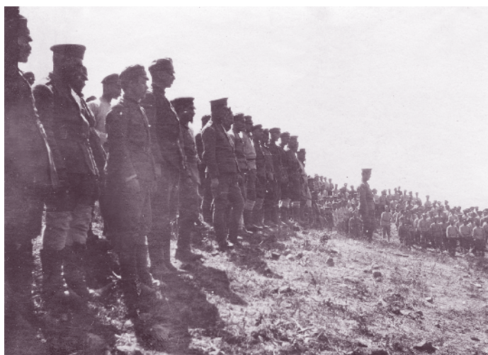
Втора дружина от 80-и пехотен полк, август 1917 г.