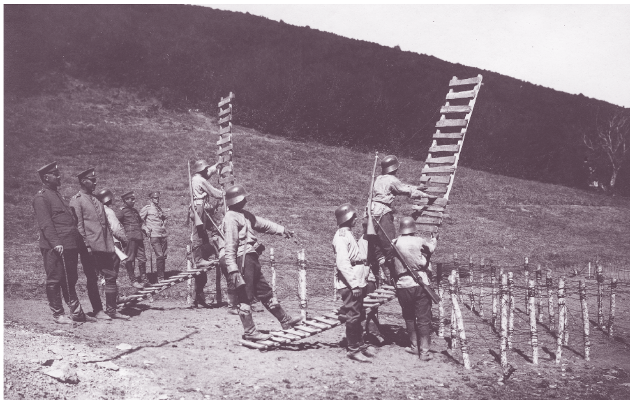
Обучение на щурмова команда от 51-ви пехотен полк през Първата световна война

Полкът участва в контраудар срещу затворената в дефилето гръцка армия – в състава на контраударната групировка на Четвърта армия, като настъпва фронтално с 28-и Стремски полк срещу позициите на противника на масива Бияз тепе. Съчетава с удара на 11-и Сливенски полк от запад, атаката е успешна и противникът е принуден да изостави масива и да се оттегли на юг към с. Пехчево. Полкът продължава да настъпва в рамките на контраударната групировка, която затваря клещите около гръцката армия в долината на р. Струма. Настъплението на румънските войски и сключеното набързо примирие спасяват гръцката армия от пълно обкръжение и разгром. На 10 август полкът е разформиран.