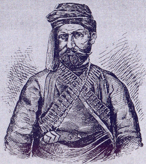
† Стоимень войвода.

С о ф и я Печатница на Гавазовъ и Чомоневъ 1903