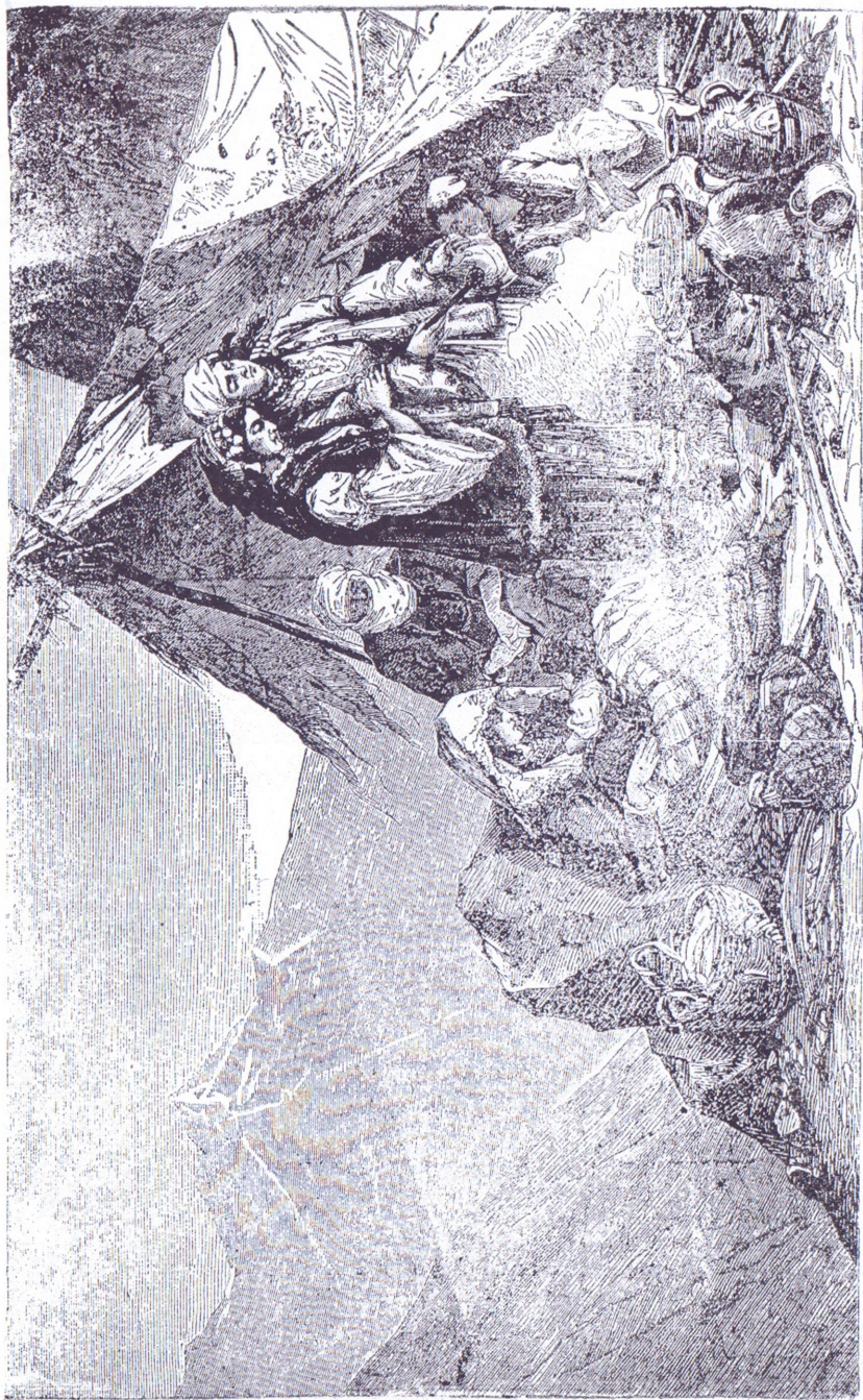
Македонски бѣжници въ Пиринъ-Планина.