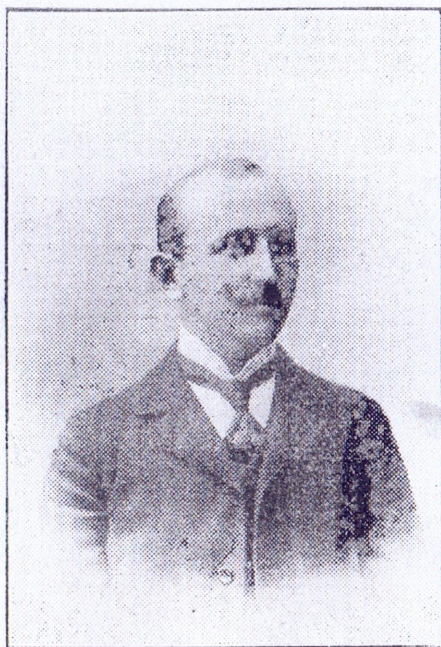
† Софроний Стояновъ