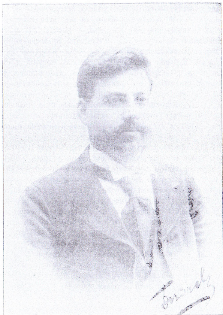
† Георги Дѣлчевъ.

Скърбната, но нѣкъ славна и херойчна смърть покоси живота на единъ отъ най-скажитѣ, доблестни и самоотвержени дѣйци на Вътрѣшната Македоно-Одринска Революционна Организация. Загина лицето, което въ продължение на 8 години